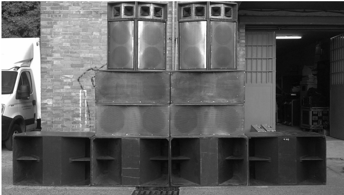
L'equip de so de One Blood Sound System al seu taller. One Blood Sound System

One Blood Sound System va ser el primer col·lectiu amb equip propi. Quan encara ningú no sabia què era aquest tipus de festa perquè no hi havia cap referent català, els de One Blood van obrir pas al moviment en l'època dels 2000.