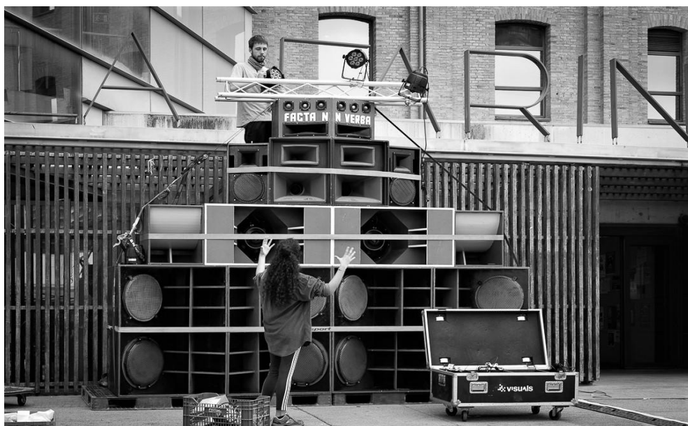
L'equip de so de Migats Sound System i Red Land Sound System. Migats Sound System

“Cada dia encara aprenc; d’altra gent, d’altres sounds. Mai he parat”. Mentre glopeja la cervesa explica com tot el que han aconseguit amb l’equip ha sigut de manera autodidacta. Cap d’ells sabia res de carpinteria i, encara menys, de so. L’únic que sabien era com portar una festa i això era suficient per encaminar el projecte.