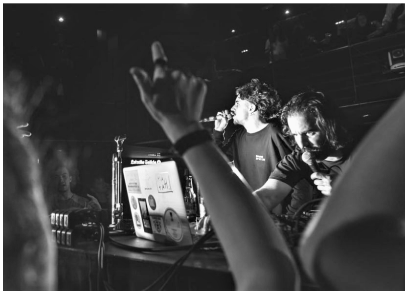
Adala i Chalart a la sala Stroika de Manresa. Marta Vilardell

— La gràcia del sound és que la gent connecti; que entenguin el missatge.