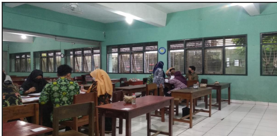
Gambar 2. Kegiatan Praktek Penilaian Self-Assesment Kesehatan Lingkungan Sekolah

Adanya penurunan persentase dari keterlibatan membaca dan telaah isi modul dengan perakteknya disebabkan oleh beberapa faktor diantaranya karena kegiatan pelaksanaan kegiatan pada hari aktif bekerja karena pesertanya adalah para guru. Selain itu masih ada 14,3 persen dari jumlah peserta yang benar – benar tidak faham bagaimana langkah - langkah dan juga manfaat dari perakteknya sehingga hal sangat memungkinkan menurunkan motivasi untuk terlibat secara maksimal. Paparan modul dilaksanakan secara online sehingga proses diskusi mendalam terkait isi modulnya sangat terbatas.