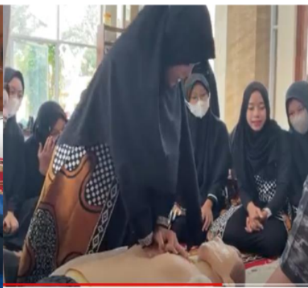
Gambar 2b. Praktek BHD oleh peserta putri