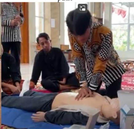
Gambar 2d. Praktek BHD oleh peserta putra