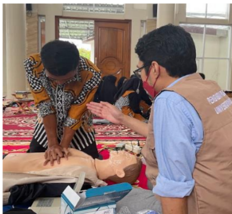
Gambar 2c. Praktek BHD oleh peserta putra