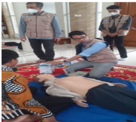
Gambar 2a. Contoh BHD dari tim PKM

5 Pelatihan dapat mempengaruhi pengetahuan secara signifikan karena memiliki faktor pendukung. Salah satu faktor yang membuat pelatihan dengan metode simulasi mampu menambah pengetahuan adalah karena peserta dibimbing langsung oleh trainer yang sudah berpengalaman. Hal ini kami lakukan pada kegiatan PKM ini, dimana penyuluhan dan pelatihan dilakukan berkesinambungan dan langsung dipraktikkan sehingga pelatih segera memberikan koreksi langsung pada semua peserta. Selain itu, peserta bisa langsung bertanya, sehingga peserta lebih paham dalam proses pelatihan.