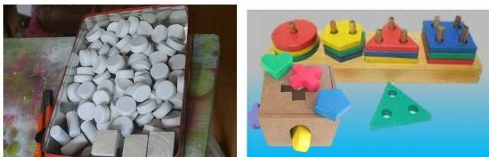
Gambar 4. Peningkatan Kualitas Produk (Aman dan Non toksin)

Selain penataan pada lantai produksi, kegiatan penyuluhan dilakukan untuk kualitas dan keamanan produk terutama produk-produk Alat Permainan Edukatif (APE). APE adalah alat permainan untuk anak usia dini yang dapat mengoptimalkan perkembangan anak, yang dapat disesuaikan penggunaannya menurut usianya dan tingkat perkembangan anak yang bersangkutan. Sehingga diupayakan yang dapat bertahan lama atau awet, mudah dibuat, bahannya mudah diperoleh dan mudah digunakan anak, tetapi aman dan tidak beracun. Berikut hasil peningkatan kualitas produk: