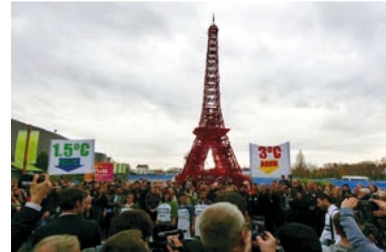
Klimatavtalet i Paris inkluderade skogens klimatnytta.

Hur skogsägarna väljer att hantera klimatutmaningen är förstas en nyckelfråga. På senare tid har därför Future Forests forskat mycket om hur skogsägarna hanterar risk och osäkerhet i relation till klimatförändringen, och om vilka former av myndighetsutövning som står till buds för att ge skogsägare bättre stöd. I den svenska modellen för skogsbruk verkar skogsägarna i frihet under ansvar,