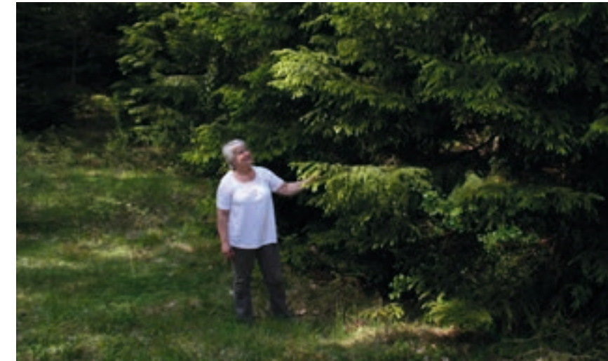
Dagens skogsägare nöjer sig inte alltid med generella råd.

En annan vanlig strategi bland konsulenterna är att använda historiska referenser. Genom att titta på ett