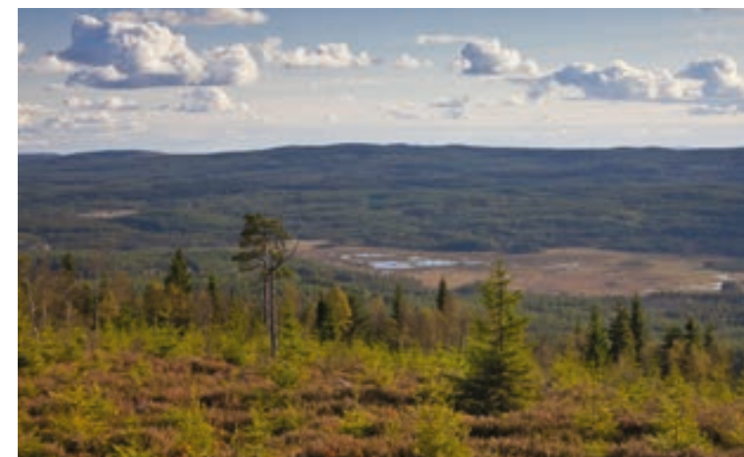
Ett svenskt skogslandskap förväntas ge utrymme åt många olika intressen.

– Det blev väldigt tydligt när vi analyserade den samlade massan av policytext. Det som lyser med sin frånvaro är verktyg för att göra avvägningar och prioriteringar mellan olika mål. Det svåra jobbet att göra avvägningar lämnas till olika typer av part-sammansatta grupper eller till enskilda markägare. Men markägarna får inte särskilt mycket stöd eller vägledning när det uppstår målkonflikter, säger Karin Beland Lindahl.