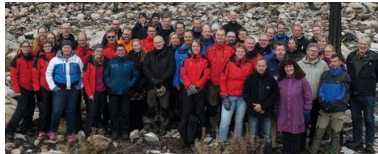
Future Forests referensgrupper är en viktig kugge i den tvärvetenskapliga forskningen. Under exkursionen i Västmanland deltog också inbjudna gäster som berättade om hur de påverkats av den stora skogsbranden.

Utvärderingsrapporten tar särskilt upp hur Mistras olika klimatforskningsprogram bidrar till att stärka svensk konkurrenskraft. För Future Forests lyfter utvärderarna fram flera saker, bland annat arbetet med att utveckla