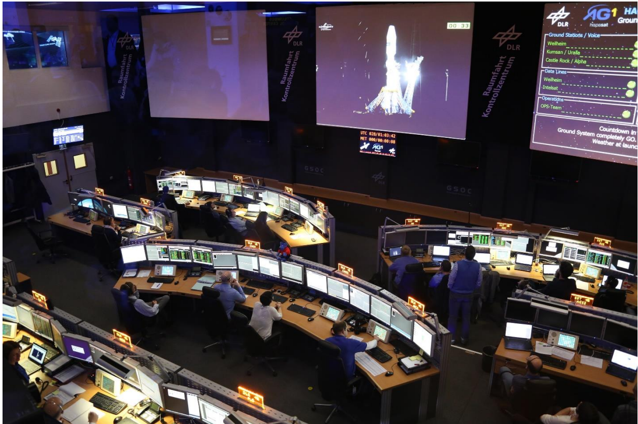
Bild 2: Der Haupt-Kontrollraum K1 des Deutschen Raumfahrtkontrollzentrums (German Space Operation Center, GSOC).

täglichen Arbeit nutzen. Diese Missionen decken hierbei ein breites Spektrum an ganz unterschiedlichen Aufgaben ab: So wurden mit dem TerraSAR-X-Satelliten sowohl LEO-LEO- als auch LEO-Boden-Verbindungen durchgeführt [8,9,12]. Im Gegensatz zu diesem 1,2 Tonnen schweren Satelliten zielt die CubeL-Mission (auch PIXL-1 genannt) auf LEO-Ground-Links ab, welche von einem Cubesat aus durchgeführt werden [21,22]. Die Mission TDP-1 ("Technology Demonstration Payload No.1"), ein Vorläufer von EDRS, nutzt wiederum ein Terminal auf dem geostationären Satelliten Alphasat, um experimentelle LEO-GEO-Verbindungen herzustellen [3,10,11,12]. Die gleiche Verbindung bietet schlussendlich das EDRS-Projekt an, dies allerdings als Teil eines in seiner Art einzigartigen kommerziellen Services. Dieser Service zeichnet sich durch hohe Anforderungen an die Robustheit der Übertragung vom LEO-Kundensatelliten zum Boden aus [12-18].