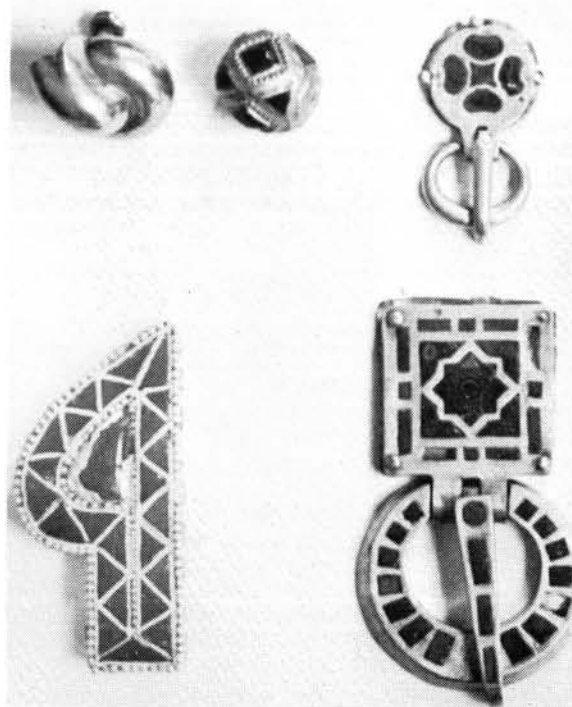
2. ábra. Ugyanaz a jobb felvételen. Archivfotó Abb. 2. Dieselbe auf einer besseren Aufnahme. Archivfoto

Kiss a kétely halvány árnyéka nélkül, teljes mértékben elfogadja, hogy a mojgrádi népvándorláskori aranyak a tiszaszőlősi „arany mellvértes lovassírból” (Reitergrab mit Goldharnisch) származnak, s ezzel eredetiségük, hitelességük problémáját megoldottnak tekinti. Ugyanakkor a maga részéről is hozzátesz a hitelesség „bizonyítékaihoz” egy megfigyelést, amellyel – akarva-akaratlan – újabb adalékkal szolgál ahhoz a megállapításhoz, hogy a mojgrádi népvándorláskori leletek hamisítványok. Megfigyeléséhez jó fénykép (2. ábra) segítségével jutott, amelyen olyan részletek is kivehetők, amelyek Fettich publikációjában nem láthatók, – amint azt maga Fettich is elpanaszolta.