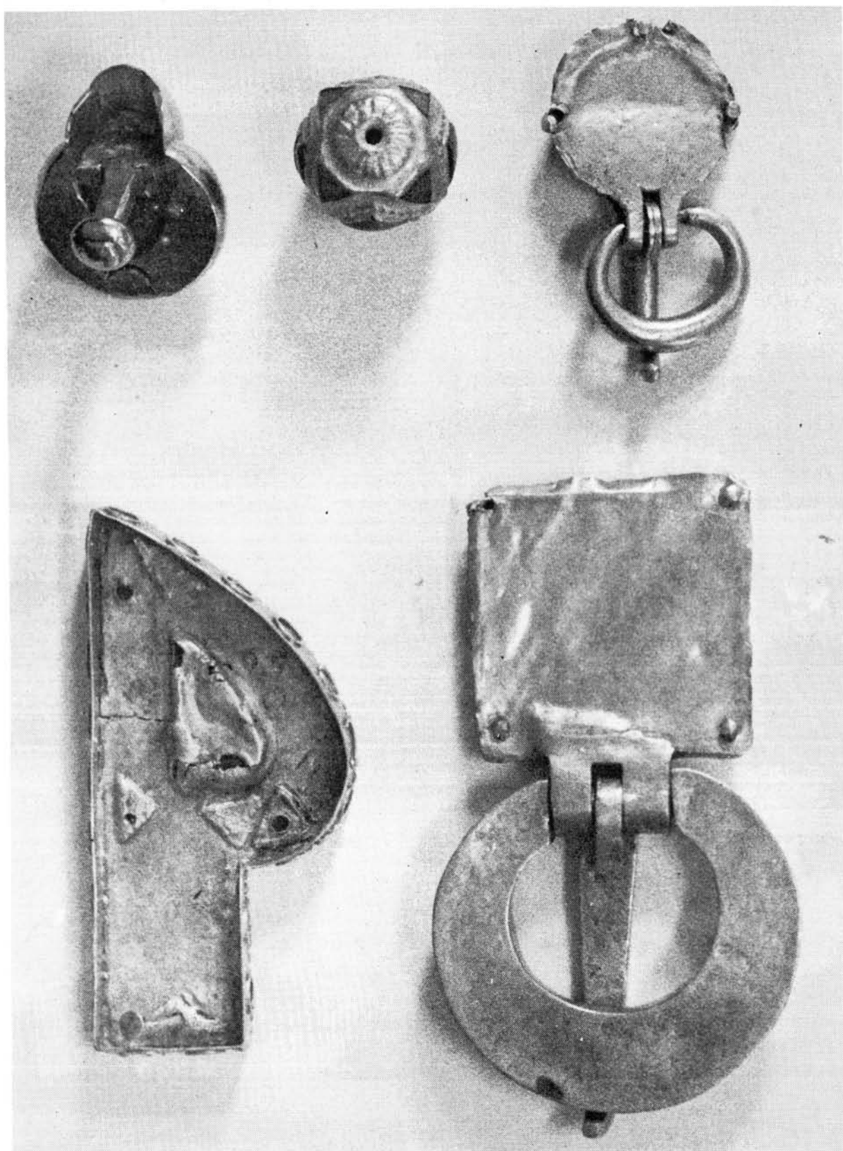
3. ábra. A moigrádi népvándorláskori stílusú aranyak hátlapja. Fettich Nándor nyomán, nagyítva. Abb. 3. Rückseite der Goldschmucke in völkerwanderungszeitlichem Stil von Moigrad. Nach N. Fettich, vergrößert.