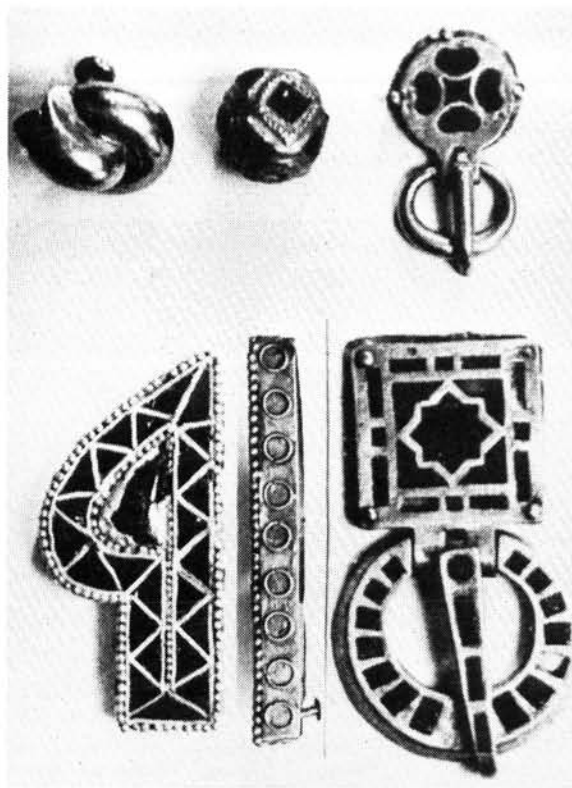
1. ábra. A mojgrádi kincs hamis népvándorlaskori aranyai. Fettich Nándor nyomán Abb. 1. Die gefälschte völkerwanderungszeitliche Goldgegenstände des Schatzes von Moigrad. Nach N. Fettich

A két új, kétségtelen hitelű nagy aranylelet szorosan kapcsolódott egymáshoz is és az apahidai I. királysírhoz is. Megsokszorozták a gepida királyi ötvösműhelyből származó alkotások számát (az I.