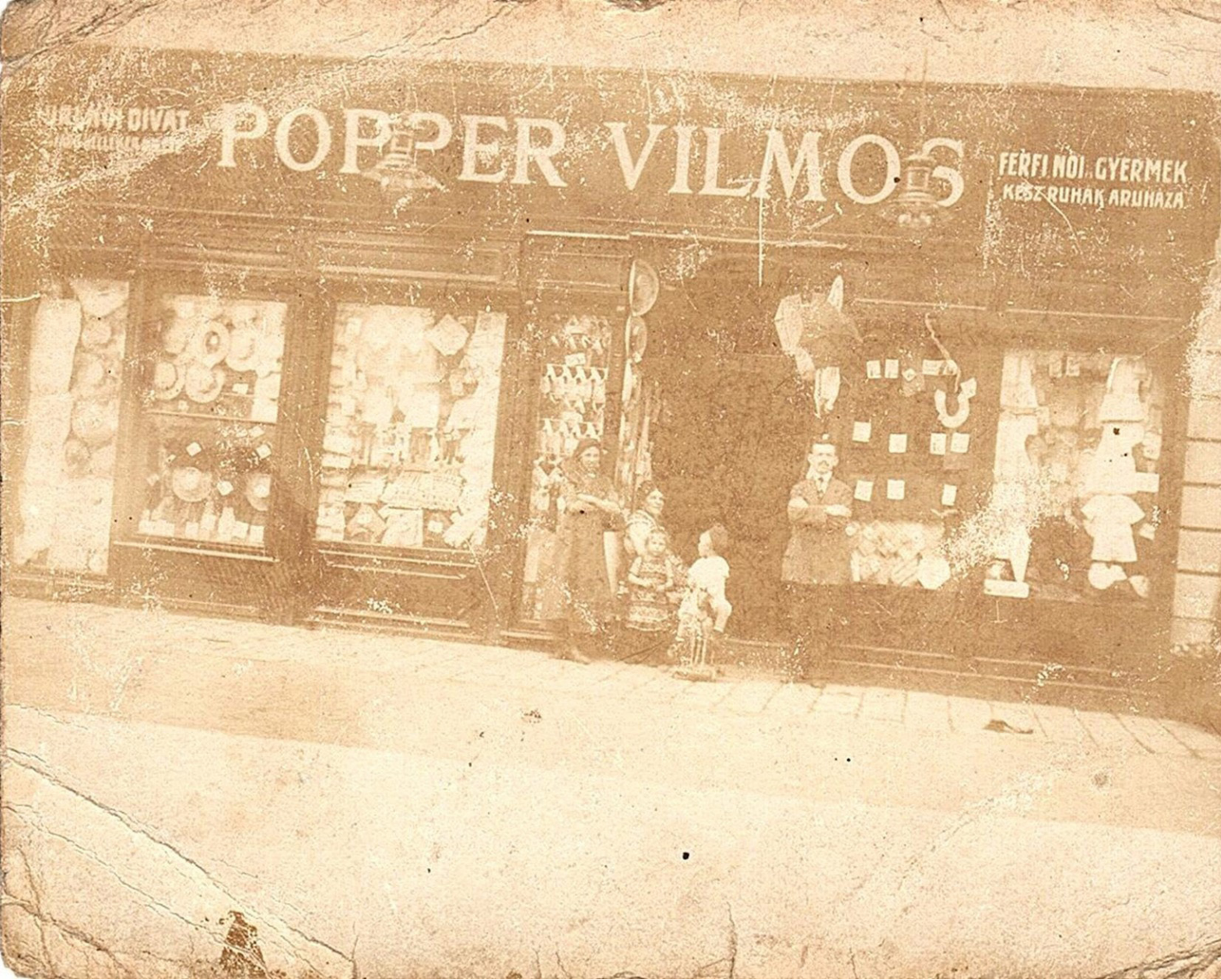
Popper Vilmos üzlete az első világháború alatt.