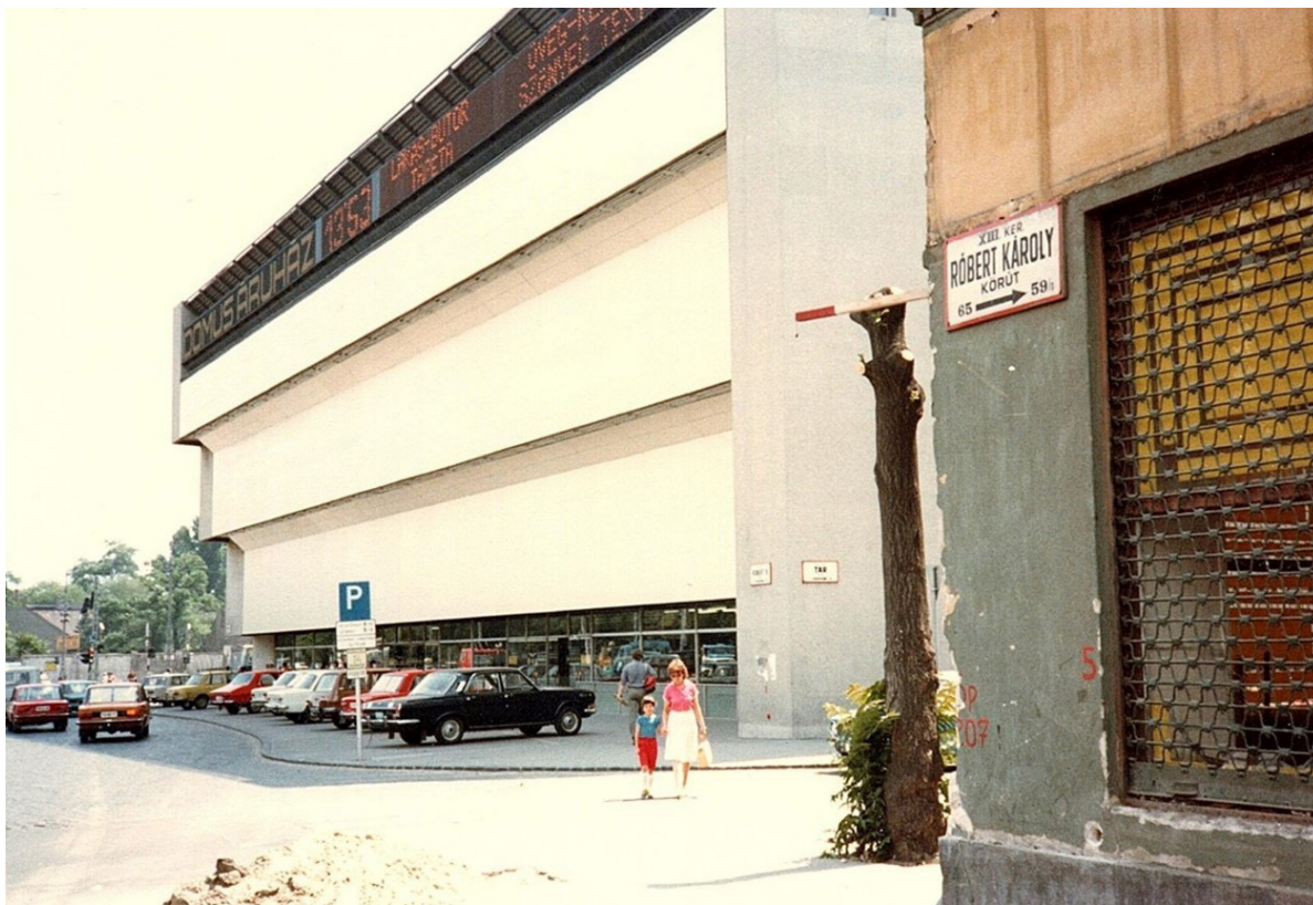
A Domus Áruház és a szanálás alatt lévő Tar utca 10.