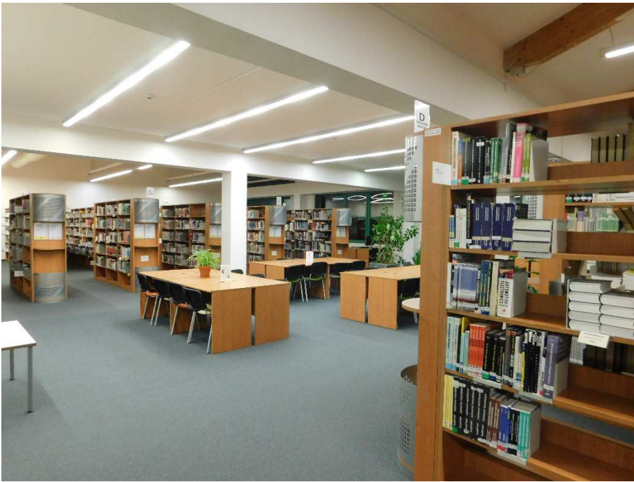
Obrázek 4: Exkurze do ÚK ZČU v Plzni, výpůjční oddělení