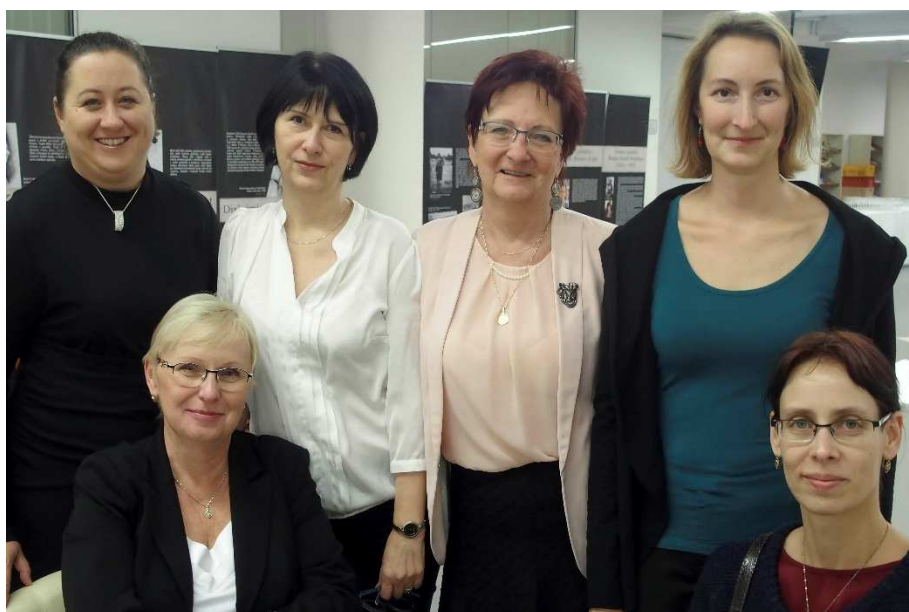
Obrázek 1: Účastnice konference z ÚK VŠB-TUO