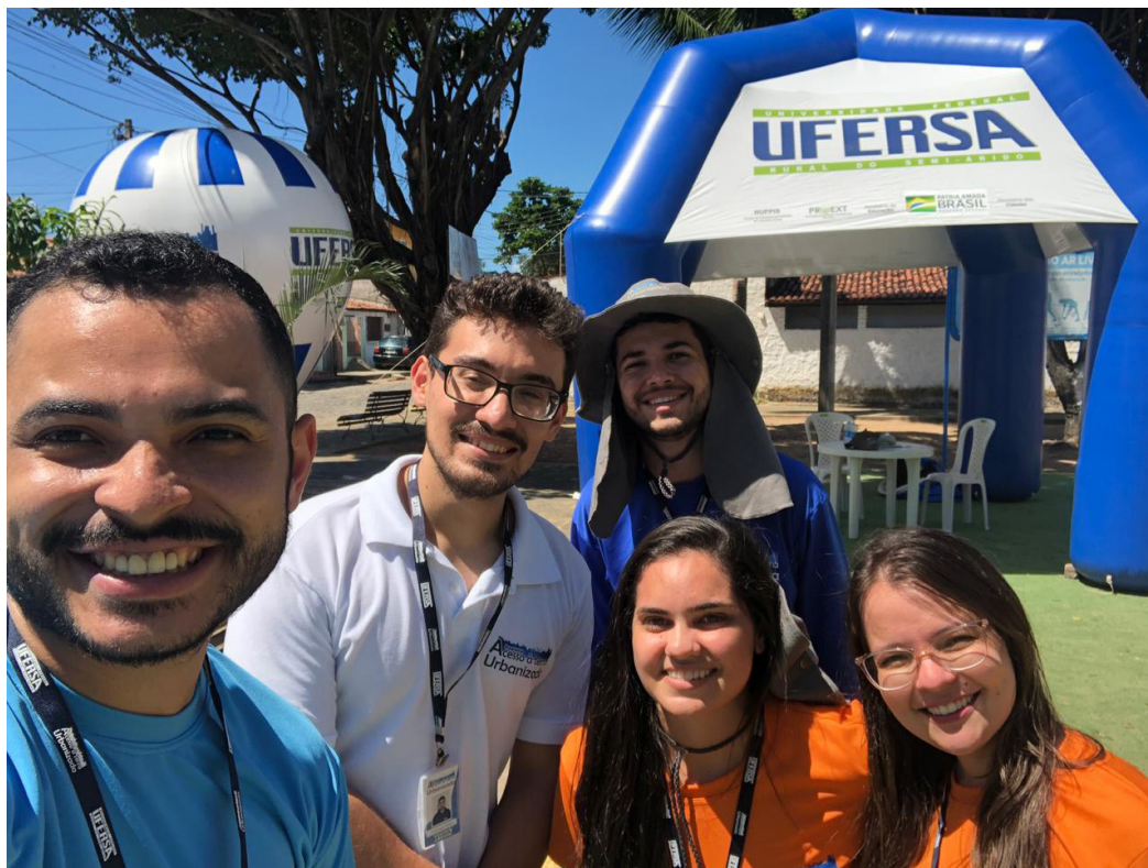
Figura 4: Posto de Atendimento para explicação da Regularização Fundiária no Eldorado.

Concomitantemente à participação na rádio e após este momento, foi montado um posto de atendimento (Figura 4) para conversa com os moradores e as residências foram visitadas para entrega de panfletos que continham os tópicos: por que participar; quem pode participar; como participar (documentos necessários e datas do cadastramento socioeconômico); contato para dúvidas.