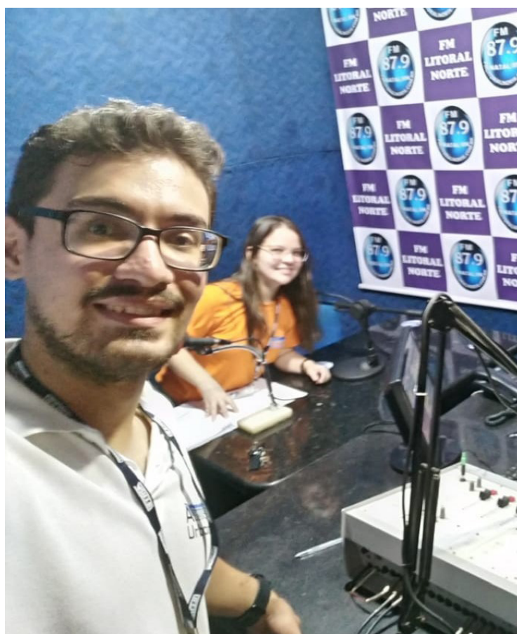
Figura 3: Participação em Rádio no Conjunto Habitacional Eldorado.

A Figura 3 mostra a entrevista concedida por integrantes do REURB-S à rádio FM Litoral Norte.