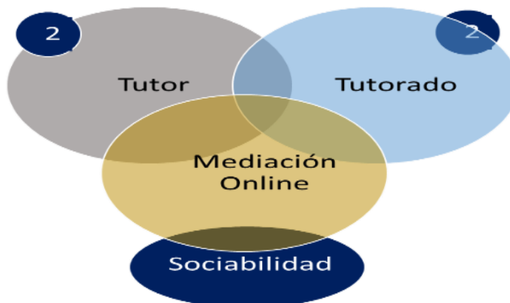
Infografía N° 2. Sujetos de Estudio.

Compleción ilustrativa, dirigida al análisis de la integración simbólica entre el tutor, tutorado y los componentes virtuales, ofrecidos por las aplicaciones empleadas en la gestión del conocimiento, entendiendo las nuevas formas en que se gestan las producciones intelectuales, por cuanto, se busca comprender los conexos de sociabilidad que surgen durante los procesos tutoriales en entornos virtuales, bajo un enfoque netnográfico en la construcción epistémica de estudiantes de Postgrado de la Universidad Nacional Abierta, Centro Local Portuguesa. Para su concreción, se obtendrá vigencia desde las voces de los sujetos de estudio, estando conformada por dos (2) estudiantes de postgrado, específicamente en la Maestría de Educación Abierta y a Distancia (uno en fase de construcción de su Trabajo de Grado y otro que lo haya defendido) y sus dos (2) tutores.