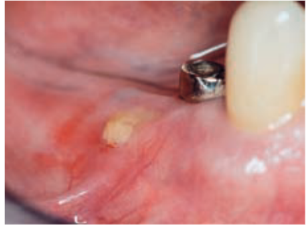
Afb. 5. Beginstadium van een bisfosfonaatgerelateerde osteonecrose van de mandibula door een drukplaats van een frameprothese.

Bisfosfonaten worden tegenwoordig veelal toegepast bij patiënten met gemetastaseerde solide tumoren (mama-, prostaat-, longcarcinoom) en bij de behandeling van het multipel myeloom. Door de remmende werking van bisfosfonaten op de osteoclastenactiviteit wordt osteolyse door metastasen geremd. Hierdoor kan de veelal optredende hypercalciëmie, met risico van nierfunctieschade, worden beperkt en kunnen pathologische fracturen worden voorkomen. Bisfosfonaten worden daarom vaak voor een lange periode toegepast. Als bijwerking van het gebruik van bisfosfonaten wordt bij 5 tot 9% van deze patiënten het optreden van osteonecrose van de kaak gezien. Het belangrijkste klinische kenmerk van osteonecrose is geel-wit blootliggend bot dat wordt omgeven door ontstoken gingiva en slijmvlies. Het bot heeft aanvankelijk een glad oppervlak en bloedt niet bij aanraken (afb. 5). Na verloop van tijd wordt het oppervlak ruw door sekwestratie van botfragmenten. Voorafgaand aan het optreden heeft meestal een behandeling in het kaakbot plaatsgevonden (extractie) (Schortinghuis et al, 2007). De behandeling van de kaakbotnecrose dient zo conservatief mogelijk te zijn in verband met het ontbreken van botgenezing door het langdurig aanhouden van bisfosfonaten op de bothuishouding. Sekwesters dienen voorzichtig te worden verwijderd. Aanwezige scherpe botranden worden veelal afgerond om mechanische beschadiging van het omgevende slijmvlies te beperken.