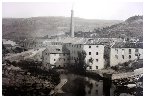
Figura 1. La Fábrica de Loza (s.f.).