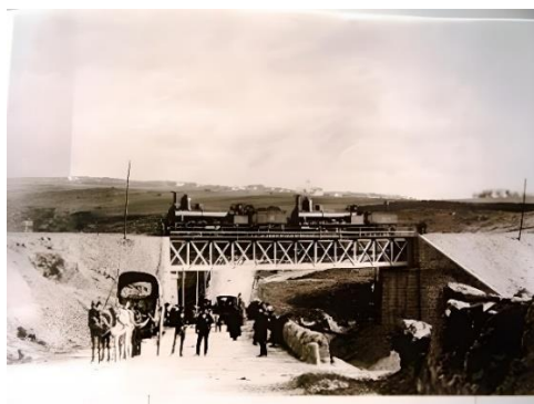
Figura 2. Línea de ferrocarril Segovia-Medina del Campo (Valladolid) por el paso del Puente de Hierro (s.f.). AMS.

“El tren (...) llegó a la estación de Segovia, donde un inmenso gentío, compuesto de todas las clases sociales, recibió, tan atónito y asombrado, el primer tren que aquí venía (...) ¡Viva Segovia! ¡Viva la civilización! ¡Viva el progreso!”. 12