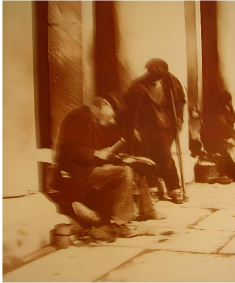
Figura 10. Zapatero trabajando en la plaza Mayor (s.f.). AMS.