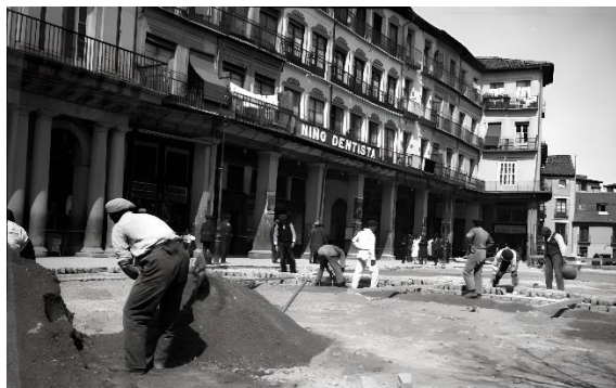
Figura 6. Jornaleros adoquinando la plaza Mayor de Segovia (s.f.).

Estas obras también podían ser propuestas por los propios parados mandando al Consistorio una relación de las calles donde podían trabajar. Aparecen en los expedientes nombres como el camino del Hospital o la calle del Juego de Pelota, destacando las labores que a su juicio hacían falta como eran el empedrado y el afirmado, entre otras. 40