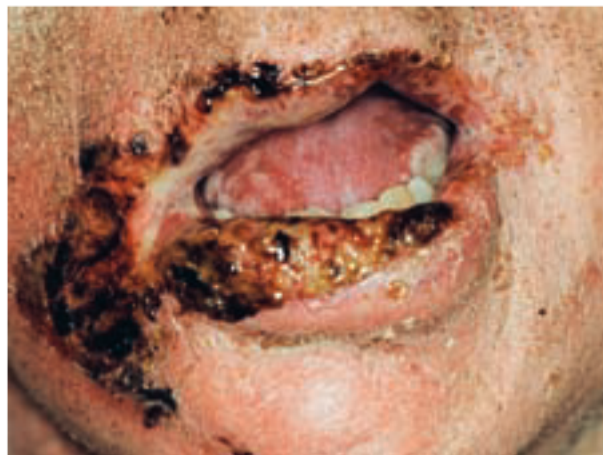
Afb. 1. Ernstige pseudomembraneuze en ulceratieve mucositis van de lippen en het mondslijmvlies die zich kan ontwikkelen tijdens de radiotherapie vanwege een tumor in het hoofd-halsgebied.

Historisch werd gedacht dat mucositis ontstond als een gevolg van de beschadiging van het epitheel. Gesuggereerd