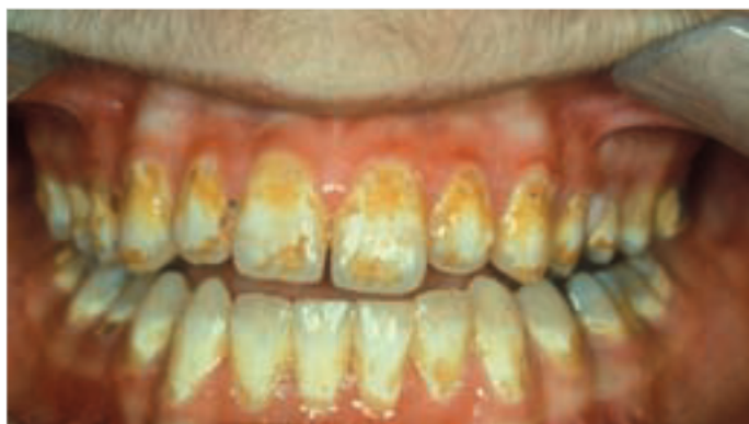
Afb. 3. Hyposialiegerelateerde cariës op de buccale vlakken van de incisieven in de maxilla en de mandibula.

noodzakelijk. Tijdens de oncologische behandeling worden spoelmiddelen aangeraden om slijmviesirritatie te verminderen, om voedselresten en plaque te verwijderen en om het slijmvlies te bevochtigen. Het wordt aanbevolen om 8-10 maal per dag te spoelen met een oplossing van fysiologisch zout of zout-soda gedurende radiotherapie en 4-10 maal per dag gedurende chemotherapie (1 theelepel zout, 1 theelepel soda op 1 liter water). Chloorhexidine is alleen geïndiceerd wanneer tandenpoetsen niet meer mogelijk is. Om een voldoende en adequate mondverzorging te kunnen bewerkstelligen worden in de meeste universitaire medische centra de monden van alle patiënten die radiotherapie in het hoofd-halsgebied ondergaan, dagelijks door een mondhygiënist gesprayd met fysiologisch zout. Voor patiënten die chemotherapie krijgen, gebeurt dit op indicatie.