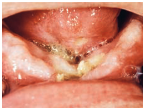
Afb. 4. Osteoradionecrose van de kaak in de oorspronkelijke onderfrontregio, gekenmerkt door een niet-genezend slijmvliesdefect en sekwesters.

De beste methode om osteoradionecrose te voorkomen is een goed uitgevoerd preventief focusonderzoek, zodat extracties en parodontale behandeling na de radiotherapie niet nodig zijn. In geval van radiotherapie moet ruimer met het indiceren van extracties worden omgegaan dan in geval van chemotherapie. Immers, in geval van radiotherapie blijft de