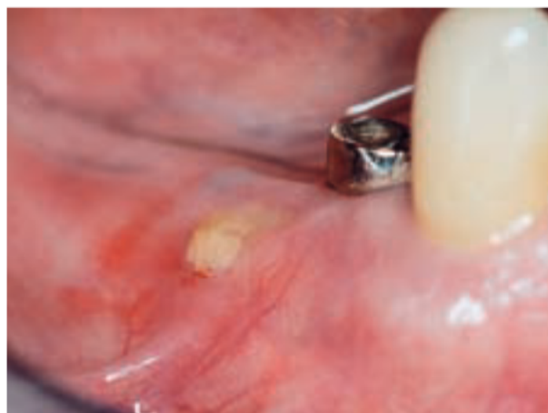
Afb. 5. Beginstadium van een bisfosfonaatgerelateerde osteonecrose van de mandibula door een drukplaats van een frameprothese.

Bisfosfonaten worden tegenwoordig veelal toegepast bij patiënten met gemetastaseerde solide tumoren (mama-, prostaat-, longcarcinoom) en bij de behandeling van het multipel myeloom. Door de remmende werking van bisfosfonaten op de osteoclastenactiviteit wordt osteolyse door metastasen geremd. Hierdoor kan de veelal optredende hypercalciëmie, met risico van nierfunctieschade, worden beperkt en kunnen pathologische fracturen worden voorkomen. Bisfosfonaten worden daarom vaak voor een lange periode toegepast. Als bijwerking van het gebruik van bisfosfonaten wordt bij 5 tot 9% van deze patiënten het optreden van osteonecrose van de kaak gezien. Het belangrijkste klinische kenmerk van osteonecrose is geel-wit blootliggend bot dat wordt omgeven door ontstoken gingiva en slijmvlies. Het bot heeft aanvankelijk een glad oppervlak en bloedt niet bij aanraken (afb. 5). Na verloop van tijd wordt het oppervlak ruw door sekwestratie van botfragmenten. Voorafgaand aan het optreden heeft meestal een behandeling in het kaakbot plaatsgevonden (extractie) (Schortinghuis et al, 2007). De behandeling van de kaakbotnecrose dient zo conservatief mogelijk te zijn in verband met het ontbreken van botgenezing door het langdurig aanhouden van bisfosfonaten op de bothuishouding. Sekwesters dienen voorzichtig te worden verwijderd. Aanwezige scherpe botranden worden veelal afgerond om mechanische beschadiging van het omgevende slijmvlies te beperken.