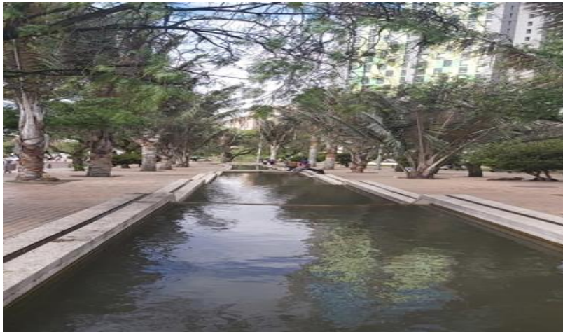
Ilustración 1. Río San Fernando, Martha L Plata.

En la presente investigación se presenta una problemática de orden social y ambiental, el cual es inherente a la oferta institucional de educación superior del área de influencia del presente estudio, en relación con las comunidades que viven de forma permanente o fluctuante en el sector del río San Francisco, el cual se encuentra con alta intervención antrópica, un recurso hídrico de gran importancia desde su nacimiento hasta el transcurrir por la zona de estudio, el cual presenta un alto nivel de desarrollo social, económico y cultural, predominando, áreas de interés académico, plazas de encuentro de los residentes, comercio, vías principales, edificaciones para diversas funciones, desde lo público hasta lo privado, zonas residenciales, entre otras más. Actividades que han alterado su dinámica fluvial, en consecuente, la deforestación o zonas de ronda hídrica intervenidas, para poder dar paso al desarrollo social, económico y cultural de la zona, por ser un sitio de alto interés de la comunidad, desde sus inicios de asentamiento, ya que en el área las diversas representaciones sociales, muestran que la zona se presentaron situaciones históricas de alta connotación, redirigiendo un estatus social del área por su valor histórico.