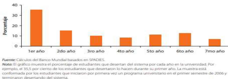
Figura 2. Porcentaje de estudiantes colombianos que desertan de pregrado, a lo largo de los diferentes años de formación de sus carreras.

Nota: Recuperado de: Banco Mundial, 2016, p. 15; basado en SPADIES, 2006.