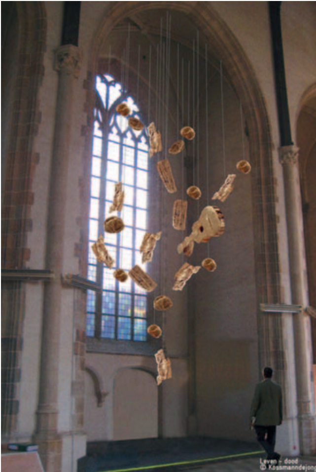
Schets Kapel van Leven en Dood met kunstwerk Guido Geelen, ontwerp Kossmann.dejong