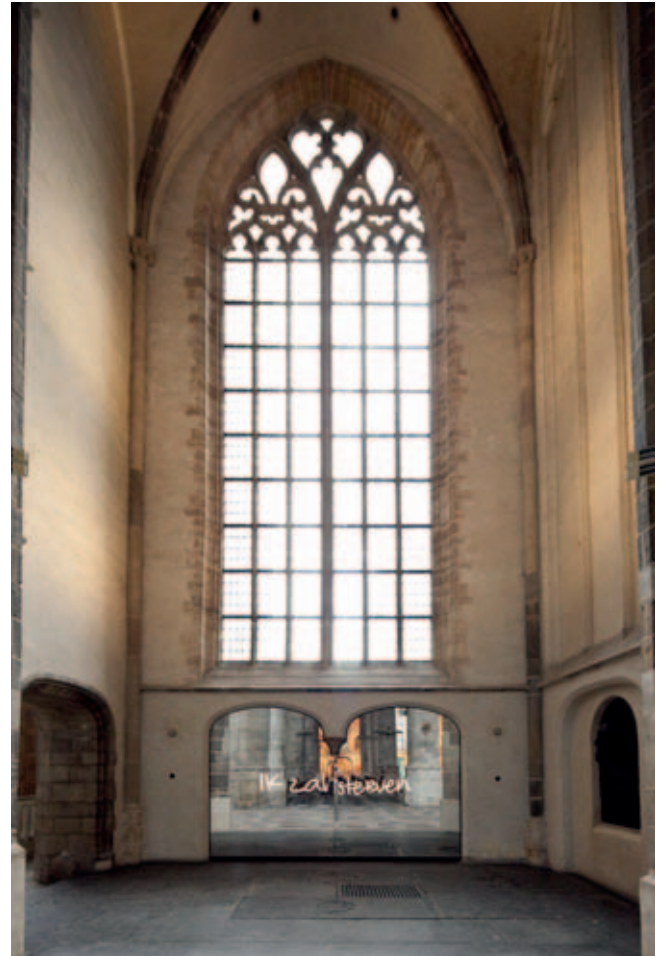
Laurenskerk, Kapel van Leven en Dood (ontwerp Kossmann.dejong)