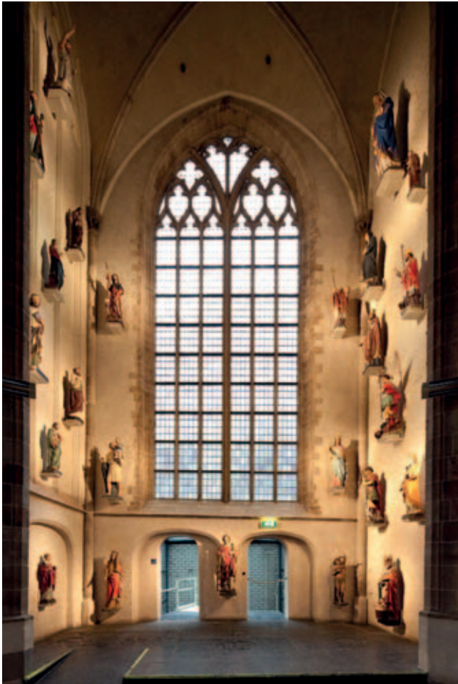
Laurenskerk, Kapel van de Heiligen (ontwerp Kossmann.dejong)

het ontwerp ervaart en zelf invult. In de loop van het proces werden bij presentaties meerdere beelden getoond zoals referentiemateriaal, verzamelbladen met de inhoudelijke ‘ingrediënten’ en meerdere schetsen, dit om te vermijden dat de gesprekken zich te veel focusten op onbelangrijke of onuitgewerkte details.