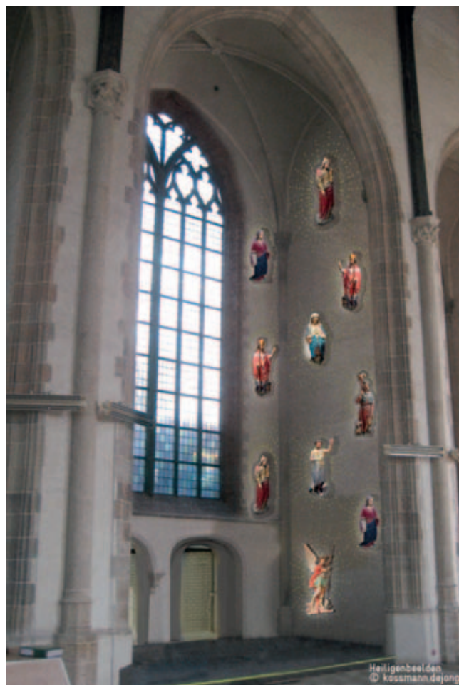
Schets Kapel van de Heiligen, definitief ontwerp, Kossmann.dejong

kers en de nieuwe vormgeving diende te passen bij de aard en geest van het gebouw. Dat er naast enthousiasme ook weerstand was tegen een tentoonstelling, betekende dat intensief overleg een wezenlijk onderdeel van het proces zou zijn.