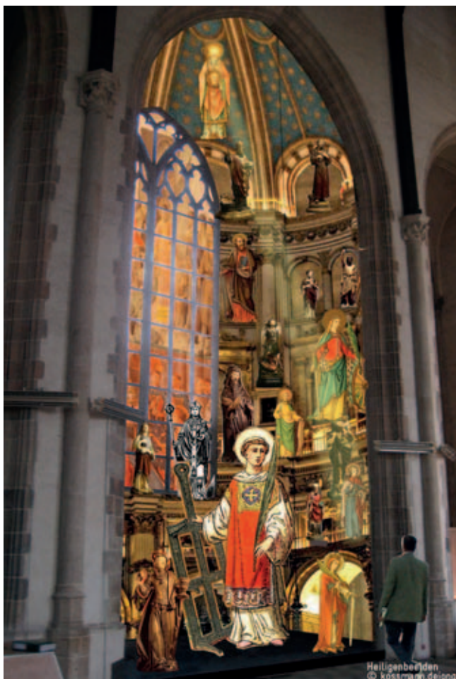
Schets Kapel van de Heiligen, voorlopig ontwerp, Kossmann.dejong