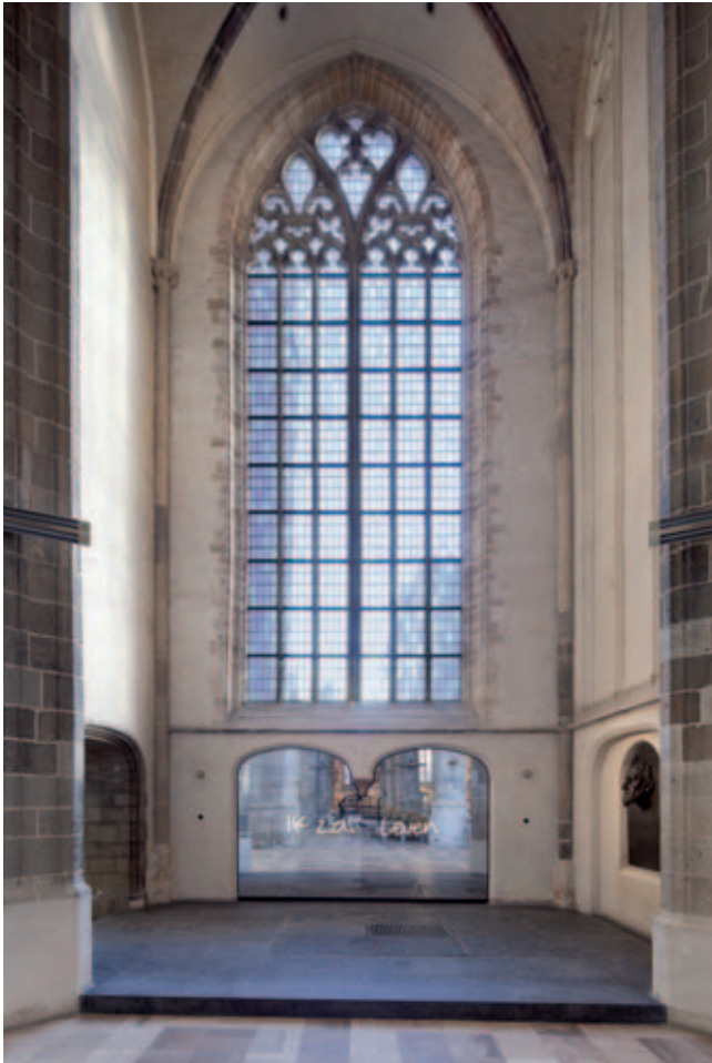
Laurenskerk, Kapel van Leven en Dood (foto Thijs Wolzak / ontwerp Kossmann.dejong)

symbool staat voor de geschiedenis van Rotterdam. Een kerkgebouw dat van zichzelf een schoonheid in de leegte bezit en dat – nog los van de bezoekers – een plek is met heel verschillende gebruikers en belanghebbenden. Je hebt te maken met de mensen die er moeten werken, zoals de koster die opbouwen voor concerten, kerkdiensten en diners, en met mensen die hier samenkomen om hun geloof te beleven. Er is een stichtingsbestuur, een team van deskundigen en een Commissie voor Welstand en Monumenten. Elk van deze groepen stelde verschillende eisen, had bezwaren en kwam met ideeën. Het ontwerpproces was een lange, interessante en soms frustrerende weg met vele verrassingen. De opdrachtgever was zich terdege bewust van de gevoelheden, had zich gecommitteerd aan de opdracht maar liet de visie, het bezielen en het overtuigen over aan de tentoonstellingsmakers. Aan het einde overheerst de trots op wat is neergezet: een nieuwe laag / inrichting / tentoonstelling – het is nog steeds moeilijk om de juiste omschrijving te vinden – die er staat alsof het er hoort. Onlangs kwam het mooiste compliment, van de voorzitter van de Vereniging van Vrienden van de Laurenskerk. Zij vertelde dat een aantal leden dat aanvankelijk zeer tegen was, zei dat ze zich vergist hadden: de kerk was er beter van geworden.