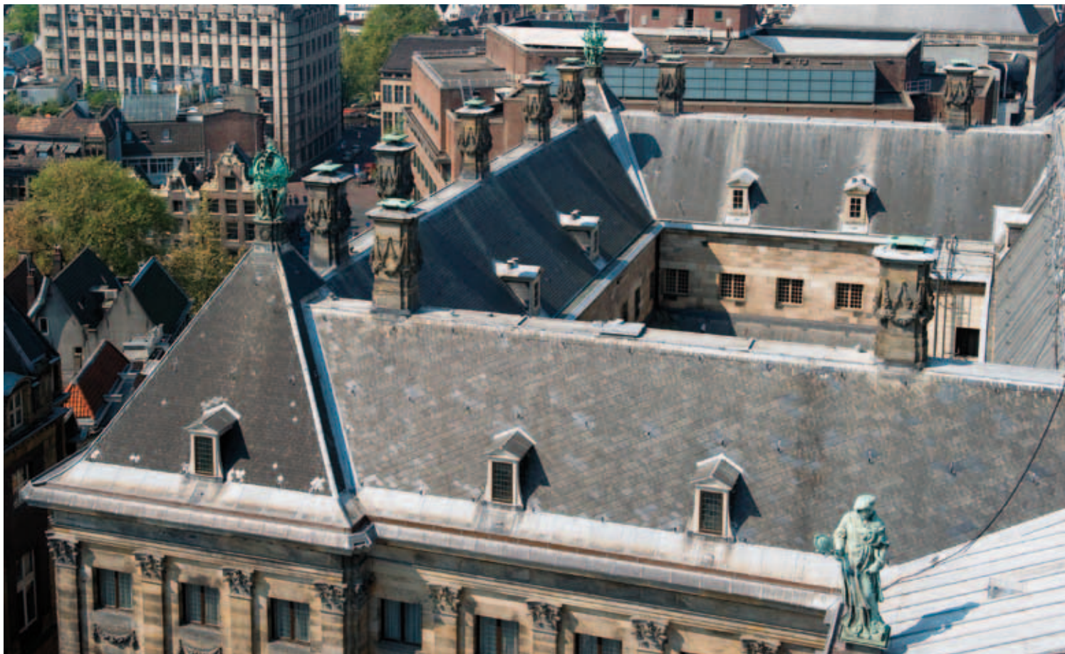
10. Onder de voorgevel met de bruin geverfde vensters die in de jaren dertig van de twintigste eeuw zijn aangebracht en tot aan de laatste restauratie altijd crèmekleurig zijn geweest. Boven een deel van de binnenplaatsgevel met oorspronkelijke bruine zeventiende-eeuwse vensters, die bij de laatste restauratie toch hun crèmekleurige uiterlijk behielden.

historische kleur van de in de twintigste eeuw aangebrachte vensters waarde gehecht. Het feit dat deze vensters altijd crèmekleurig zijn geweest, werd genegeerd.