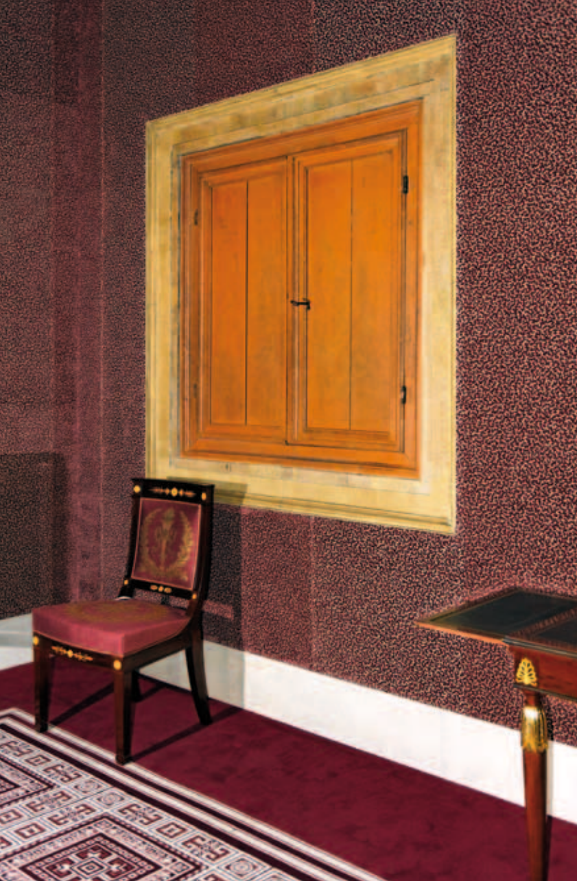
3. De Secretarie met de teruggevonden muurkast met wagenschotkleur

restauraties in de jaren dertig en zestig van de vorige eeuw waren erop gericht het gebouw zoveel mogelijk terug te brengen in de zeventiende-eeuwse staat en te relateren aan de oorspronkelijke functie van stadhuis. Daarbij werd voorbijgegaan aan het feit dat het gebouw nog altijd werd gebruikt voor tijdelijke bewoning en koninklijke representatie.' Er moest worden gestreefd naar een hernieuwde alliantie tussen de zeventiende-eeuwse stadhuisinterieurs en de negentiende-eeuwse paleisinrichting. De voorgaande restauraties zouden het zeventiende-eeuwse stadhuis en het negentiende-eeuwse meubilair te veel als aparte entiteiten hebben beschouwd. 13 Daarnaast had Van den Ende kritiek op de in de jaren zestig aangebrachte paarsrode afwerklaag op de zeventiende-eeuwse cassettenplafonds: de vorige restauratiearchitect (Wegener Sleeswijk) had de zeventiende-eeuwse kleur van de luiken van de Wisselbank overgenomen in plaats van de kleu-