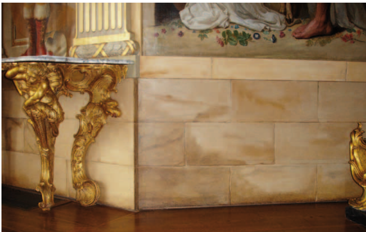
9. Huis ten Bosch met de door Jacob van Campen ontworpen Oranjezaal, waarvan de plint beschilderd is met imitatie zandstenen blokken. De blokken zijn niet in een egale kleur geschilderd, maar vertonen de natuurlijke nuances van zandsteen