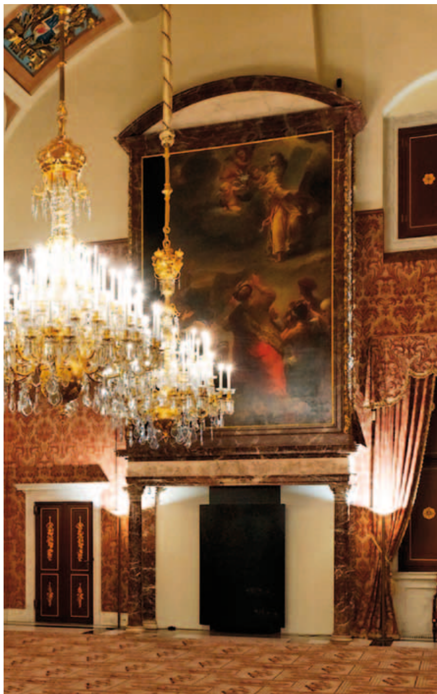
7. De Schepenzaal met de Korinthische schouw in wit en rood marmer

Deze stelling lijkt in het geval van het Amsterdamse stadhuis echter onhoudbaar. De architectuur van de kamers is afgestemd op de eerbaarheid van de administratieve colleges die hier kantoor hielden. De burgemeesters hadden de hoogste rang en dit vond uitdrukking in de uitwerking van hun kamer. De schouw is uitgevoerd in Carrara marmer in een Korinthische orde, waardoor de profileringen in deze kamer het meest uitgewerkt waren (afb.6). De Schepenen waren in rangorde net iets minder belangrijk. Hun kamer werd weliswaar in een Korinthische orde uitgevoerd, maar hun schouw bestond uit een mengeling van rood en wit marmer (afb.7). Het subtiele onderscheid tussen