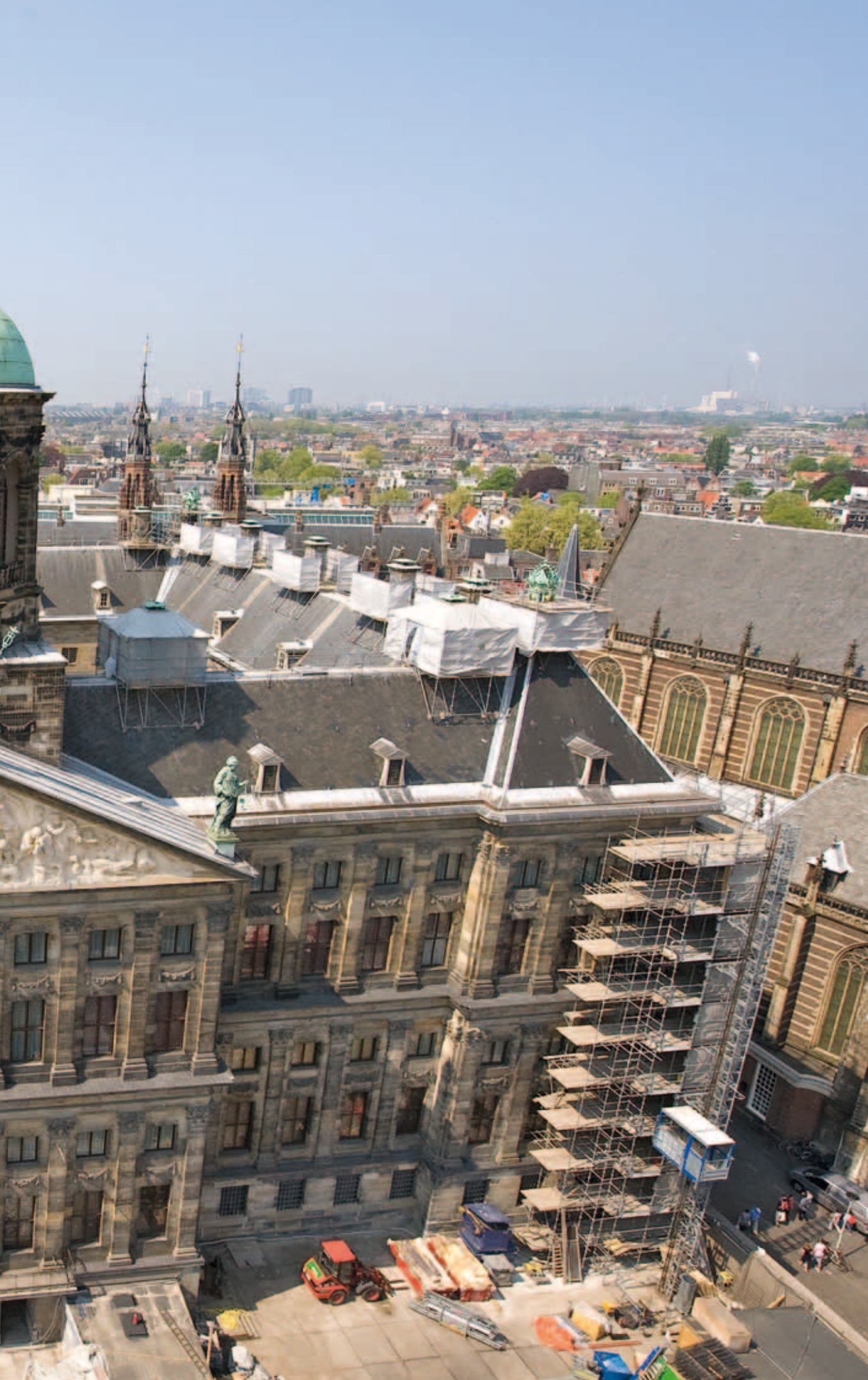
8. De ontstoorde voorgevel na de laatste restauratie met de bruin geverfde vensters. Het timpaan met beeldhouwwerk trekt door de lichte kleur de meeste aandacht