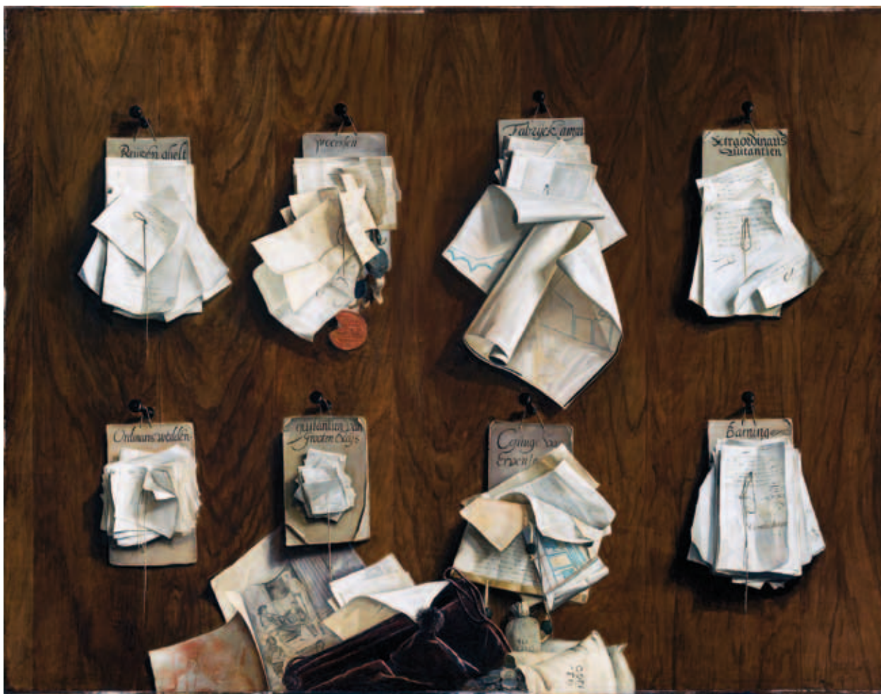
5. Cornelis Brisé, trompe l'oeil van de documenten van de Thesaurie Ordinaris, 1656