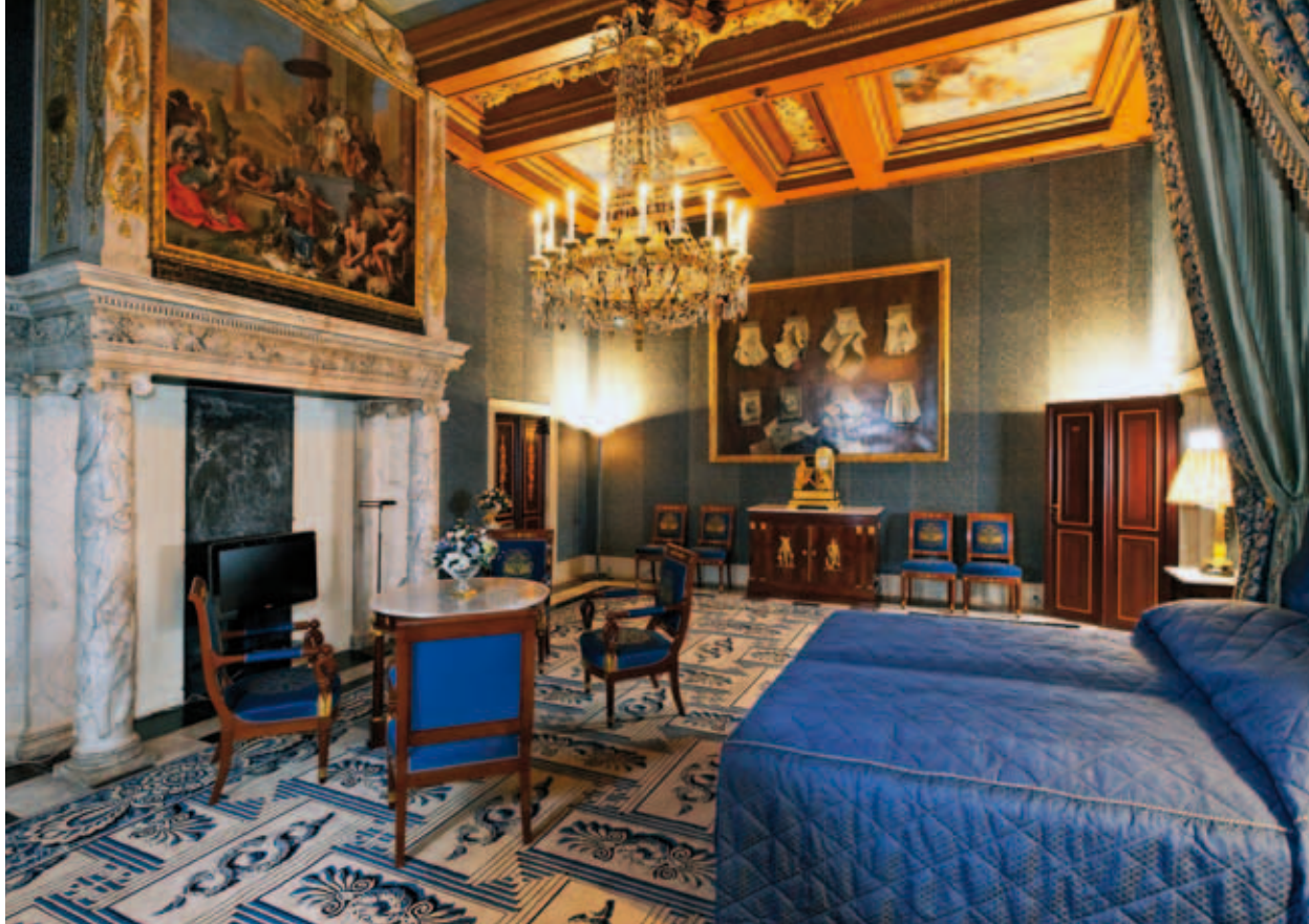
4. De Thesaurie Ordinaris met lichtbruin plafond en paarsrode deuren in de huidige toestand. Tegen de achterwand hangt het schilderij van Cornelis Brisé, zie afbeelding 5