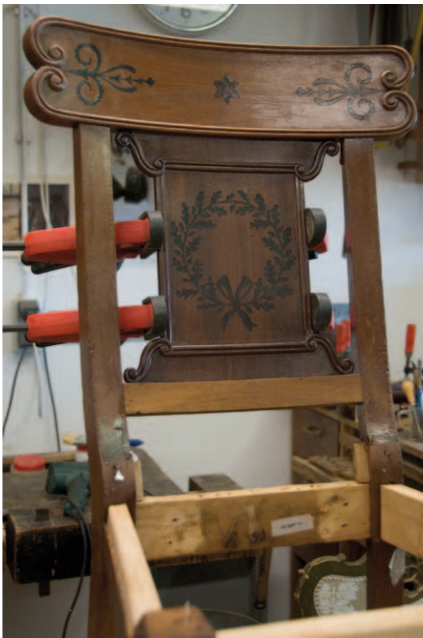
3. Detail van de rug van een van de stoelen geleverd voor de Grote eetzaal, tijdens restauratie

De meubelcommissie bezocht kort na aanvang van de restauratie de ateliers van alle deelnemende meubelrestauratiebedrijven. Tijdens het bezoek aan restauratoren Nico Hijman en Vincent van Drie is een aantal Breyspraak-stoelen bekeken. Een stoel bleek onder de bekleding nog een bekleding met rood laken te hebben, waarop bovendien te zien was waar passement gezeten had (afb.4). Uit onderzoek door stoffeerder Dick Oostendorp bleek dat dit een restant van de origi-