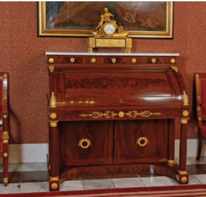
5. Het cilinderbureau geleverd door Carel Breyspraak sr. (inv. nr. KP 4183) in september 1808 voor het appartement van de koning, in de nieuwe opstelling