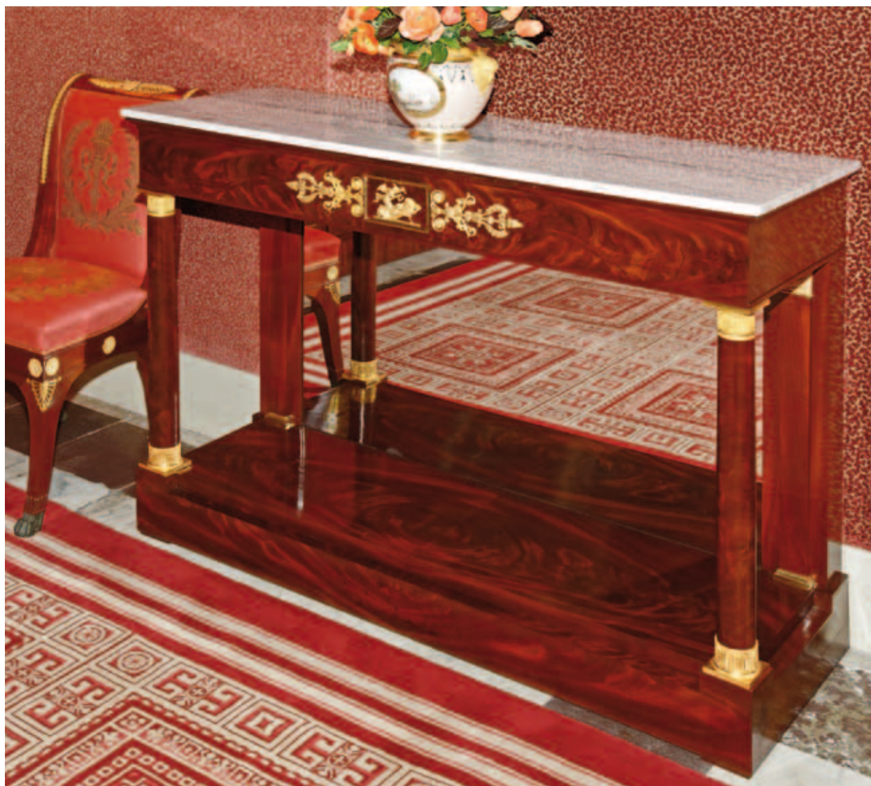
9. De consoletafel geleverd door Carel Breyt spraak sr. (inv. nr. KP 4123) in mei 1809 voor het appartement van de kroonprins, in de nieuwe opstelling

De consoletafel (inv.nr. KP 4123) is opgebouwd uit eiken blindhout met mahonie fineer (afb.9). Hij heeft