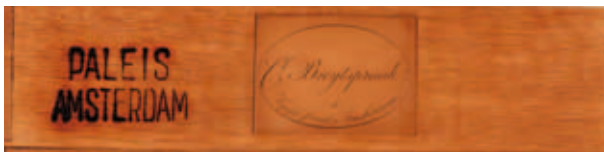
7. Etiket van de firma Breyspraak, aangetroffen op de achterzijde van een lade van een secretaire (inv.nr. KP 4108) voor het appartement van de kroonprins

nele bekleding was en er werd besloten om dit als voorbeeld voor de nieuwe te gebruiken. Dit in tegenstelling tot de meeste andere zitmeubelen waarbij op een enkele uitzondering na de originele bekleding ontbrak en gekozen is voor op empire geïnspireerde stoffen.