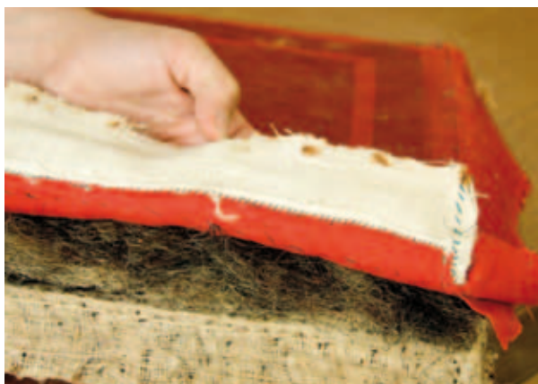
4. Stoffering van een van de stoelen geleverd voor de Grote eetzaal, tijdens restauratie