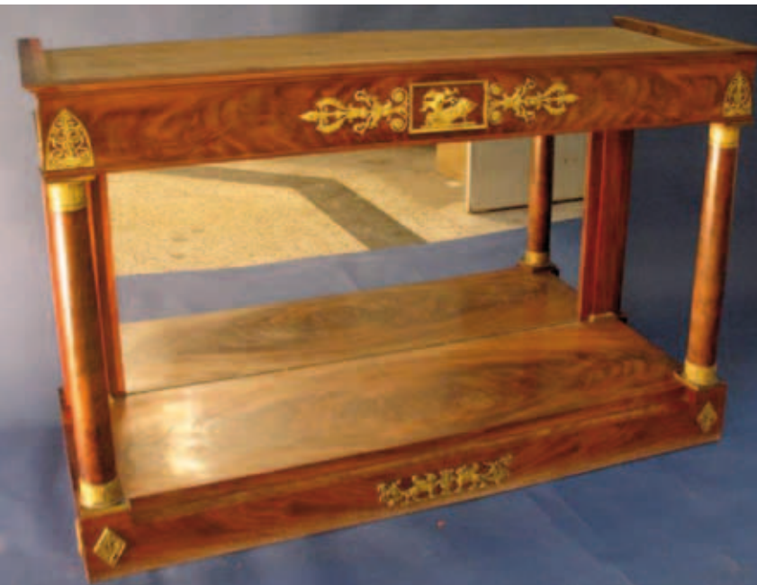
10. De consoletafel van afbeelding 9 voor restauratie. Later toegevoegd verguld beslag is hier nog aanwezig

twee ronde kolommen op een rechthoekige plint, eveneens gefineerd, een wit marmeren blad en een spiegel in de achterwand. Doordat de voor- en zijkan- ten van de plint tussen de kolommen inspringen lijkt deze uit twee lagen te bestaan. Het mahoniefineer is overal gespiegeld aangebracht, zoals bij het cilinder- bureau. Het mahonie was bedekt met een sterk ver- geelde afwerking, met veel vochtplekken op de plint. 38 De plint was bovendien naar achteren afgeschuind. Dit is aangevuld, eerst met eiken constructiehout en vervolgens met een bijpassende strook fineer. De oude afwerking is opgelost met ethanol om er een nieuwe schellakpolitoer op aan te brengen die het mahonie weer glans en diepte geeft.