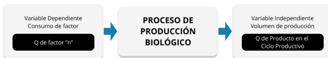
Gráfico 1. Diagrama del proceso de producción biológico según la TGC