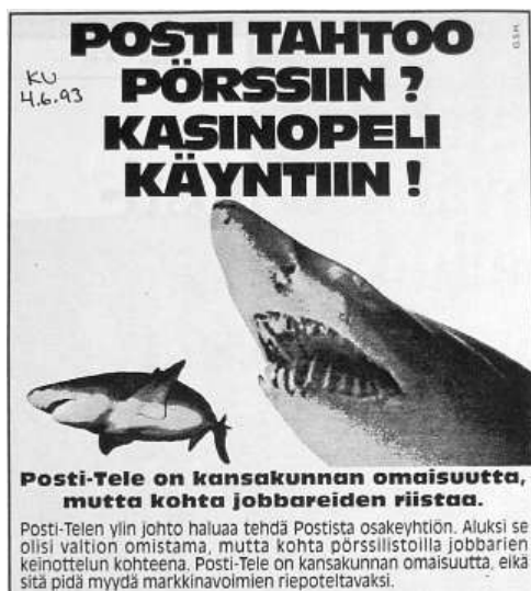
Kuva 1. Suurten liikelaitosten yhtiöittäminen kosketti kymmeniä tuhansia työntekijöitä ja herätti ristiriitaisia tunteita myös laajassa yleisössä. Erään suuren ammattiliiton ilmoitus Kansan Uutisissa 4.6.1993.

tiin valtion posti- ja telelaitoksen vahvistamista ulkomaisia kermankuorijoita vastaan. Jo ennestään ” Kauppalehtiä lukevalle” laitoksen johdolle oli annettava keinot vastata kilpailuun. 44 Liikelaitosuudistus toteutui posti- ja telelaitoksen kohdalla vuoden 1990 alusta.