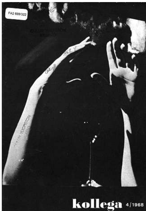
Synkkää psykedeliaa Kollegan itsemurha-numeron kannessa.

taitteen itsemurhakeskustelun kriittisistä puheenvuoroista.