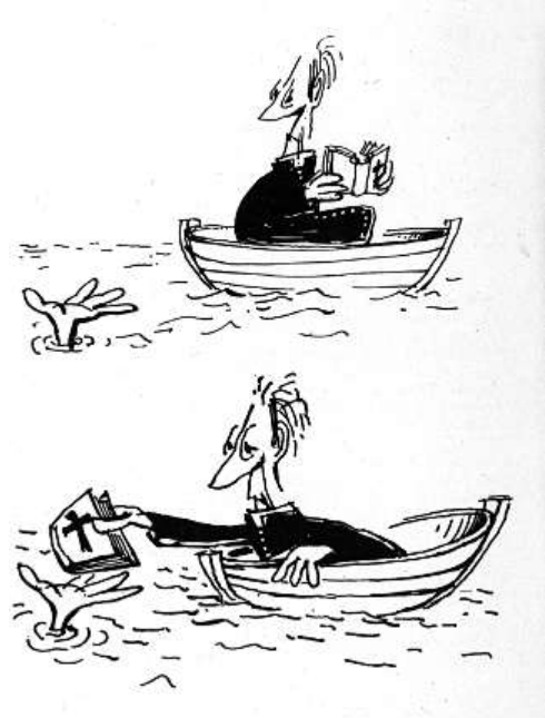
Yhteiskunnallisten instituutioiden suhde hädänalaisiin oli tyypillinen kritiikin aihe Kollega -lehden kuvituksessa 1960-luvun lopussa.