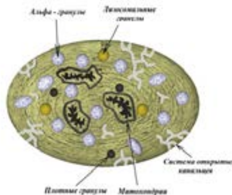
Рис. 1. Строение тромбоцита (авторская иллюстрация)

ность. Тромбоциты лишены ядер, а внутри содержат эндоплазматический ретикулум, митохондрии и многочисленные гранулы в количестве 60–70 на каждую клетку [18–20] (рис. 1, 2).