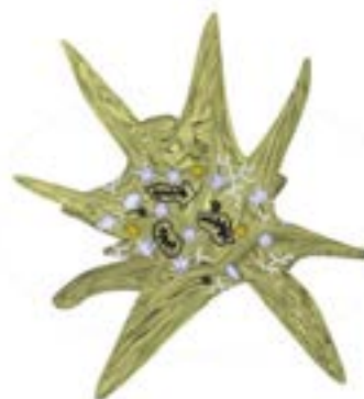
Рис. 2. Активированный тромбоцит (авторская иллюстрация)

Гранулы тромбоцитов представляют наибольший интерес для изучения и делятся на три типа: альфа гранулы, плотные гранулы и лизосомальные гранулы [21–23] (табл. 1).