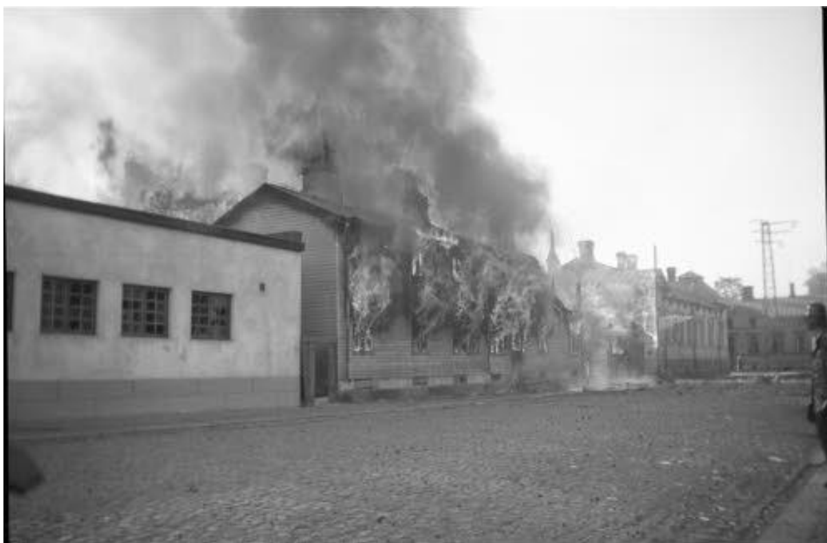
Kuva 7. Turun puutaloja tulessa 25.6.1941.