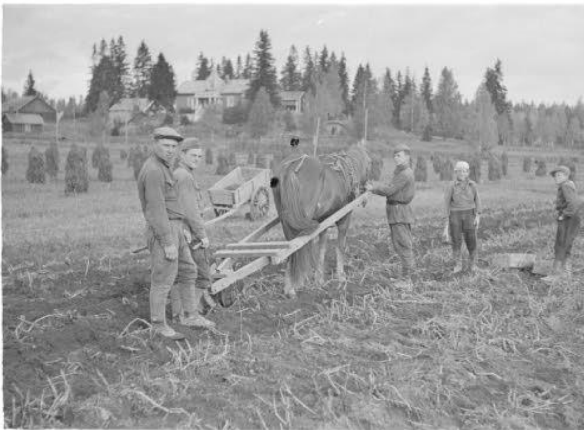
Kuva 1. Sotavangit maanviljelystöissä Helsingin lähellä maaseudulla 3.10.1941.

Sotavankiviranomaiset valittivat erityisesti vankien vartioinnin laiminlyönneistä. 48