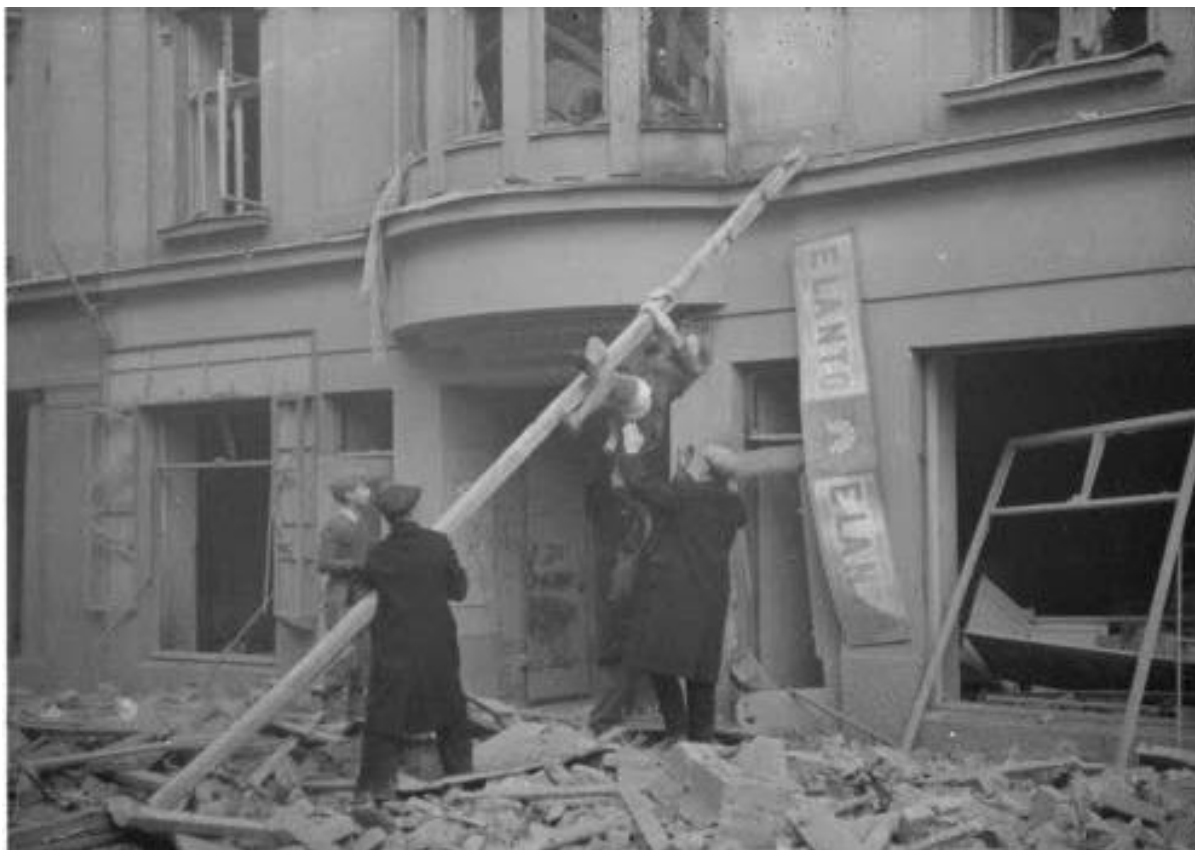
Kuva 6. Koiraa pelastetaan Helsingin ensimmäisestä pommituksesta Lönnrotinkadulla 30.11.1939 (koira ikkunassa).