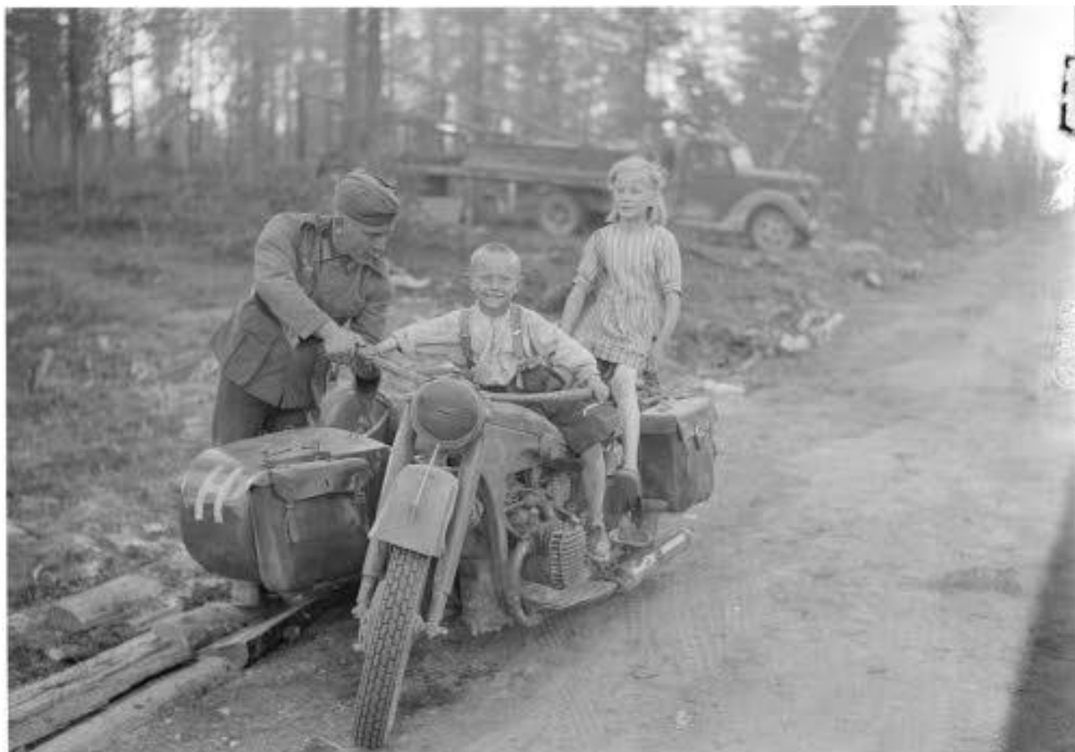
Kuva 2. Saksalaissotilas ja kaksi suomalaista lasta Raatteen tiellä 1.7.1941.

Sota-aikana Turussa elänyt ”Mäenrinteen poika”-nimimerkkiä käyttänyt henkilö muisti saksalaissotilaat, joita oli majoitettu kaupunkiin. Turussa kouluja oli muutettu kasarmeiksi. Saksalaissotilailla oli tiukka kuri eivätkä he saaneet poistua kasarmilta. Lapset, pääasiassa pojat kävivät ostamassa sotilaiden puolesta olutta. Noutoreissuista pojat saivat palkaksi juustoa, leipää ja tupakkaa. ”Mäenrinteen poika” antoi itse saamansa tupakan isälleen, joka oli siitä erittäin mielissään. Turkuun majoitetut saksalaiset merisotilaat olivat nuoria ja he tykkäsivät leikkiä turkulaisten poikien kanssa lumisotaa. 68