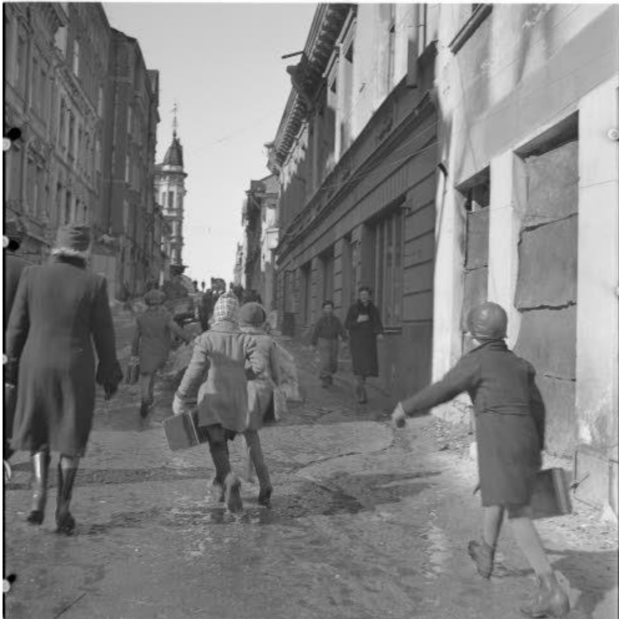
Kuva 4. Lapsia koulumatkalla Viipurissa 1.4.1942.

koulua käytiin taas siellä. Sitten syksyllä 1944 piti sijoittaa kouluihin uudelleen noin 49 000 evakkolasta. Negatiivinen ilmiö oli evakkolasten, erityisesti ortodoksisten rajakarjalaisten sekä inkeriläisten kokema kiusaaminen ja ”ryssittely”. 99