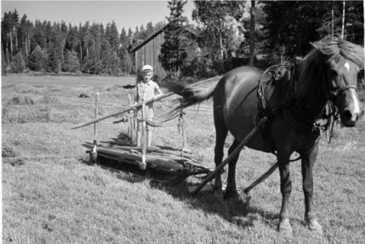
Kuva 9. Lapsi maa- ja kotitaloustehtävissä 20.7.1941.