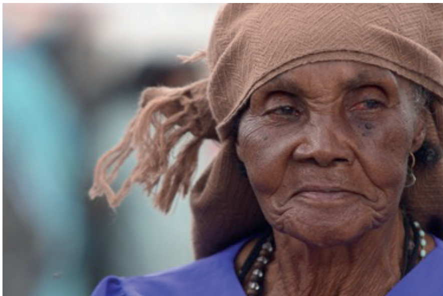
Figura 14: Grupo afroecuatoriano