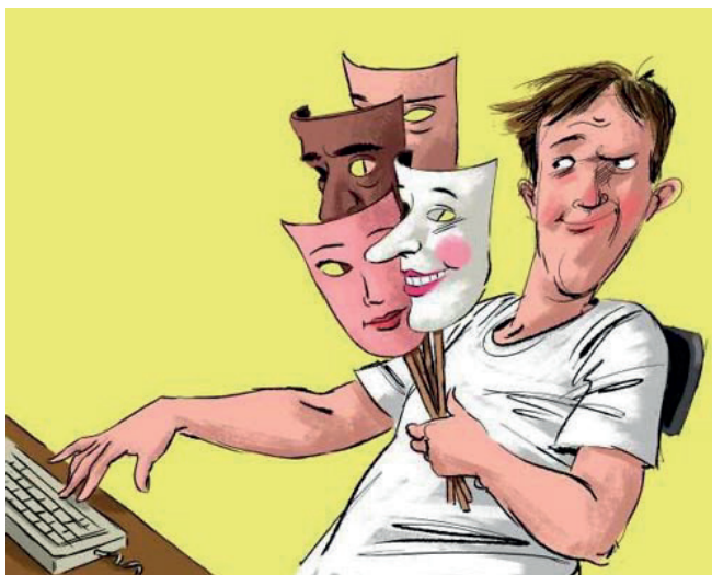
Figura 11: Tu identidad es del todo tuya

A medida que crecemos y gracias a las cosas que suceden a nuestro alrededor, a otras personas, a la educación familiar y formal y a la sociedad a la que pertenecemos las personas vamos cambiando. Por lo tanto, la identidad es un conjunto de cualidades que dan a la persona a un grupo particularidad que los caracteriza y los diferencia de las otras personas. (Tibán, 2009, pág. 11)