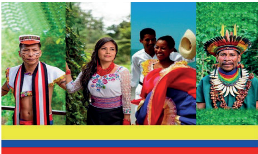
Figura 13: Pueblos y nacionalidades indígenas del Ecuador