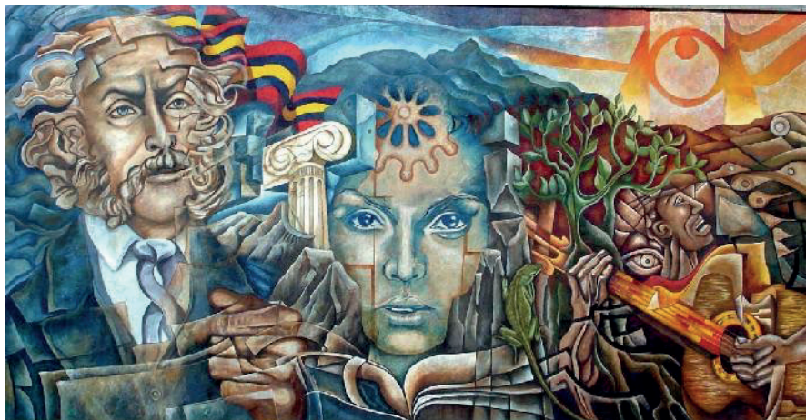
Figura 12: La verdadera identidad