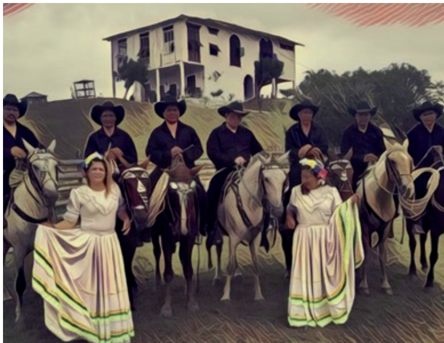
Figura 15: Identidad montubia