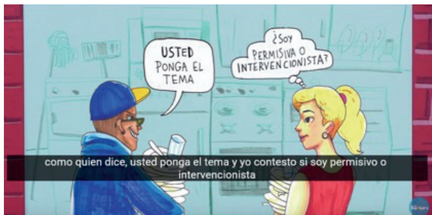
Figura 1 Ideologías políticas: permisivos o intervencionistas