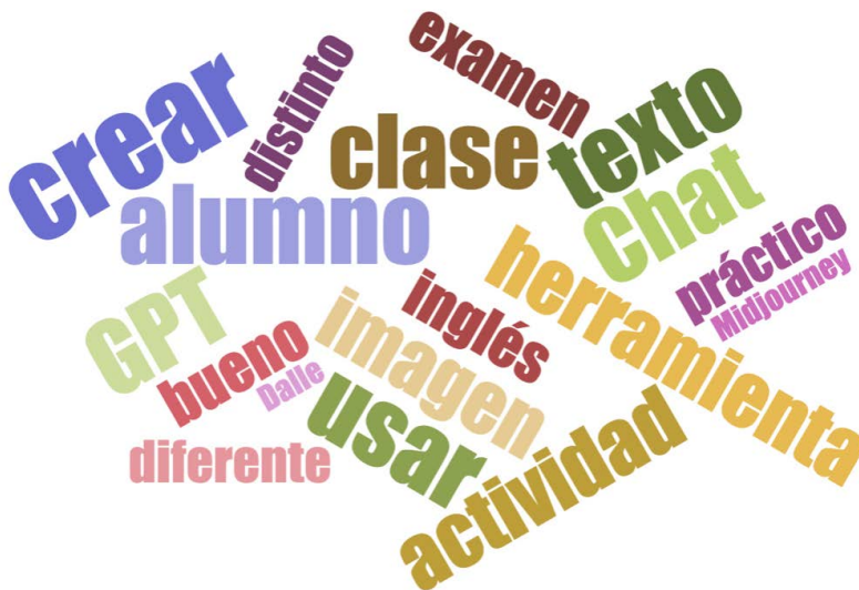
Figura 2. Nube de palabras de los términos más mencionados en los comentarios

De los 91 comentarios, se han encontrado 38 que se refieren al uso de la IA en actividades con alumnado en el aula, mientras que 53 se refieren a un uso de la IA como apoyo al docente para la investigación o para preparar materiales o dar ideas. Los comentarios han sido categorizados y contabilizados en base a los temas comunes que surgieron en relación con el uso de la IA en la educación. Esto ha permitido plantear una relación de tareas con ejemplos dados por el profesorado (tabla 1).