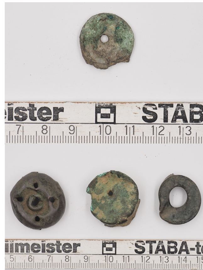
Рис. 3. Аксесуари люльок із розкопок у м. Полтаві. Кінець XVIII – перша третина XIX ст. Металевий сплав, лиття, карбування. Розкопки Юрія Пуголова 2019 р.

Ще дві кришки передали до фондів історико-культурного заповідника «Більськ» місцеві мешканці. Вони мають розміри 1,05×2,6 см і 1,5×2,9 см і типові для цих виробів форму та декорування. Одна із них, прикрашена десятикінцевою квіткою, аналогічна виробу з Опішні. В публікації вони також атрибутовані як «покришки до керамічних люльок-носогрійок XVII–XVIII ст.» 19 .