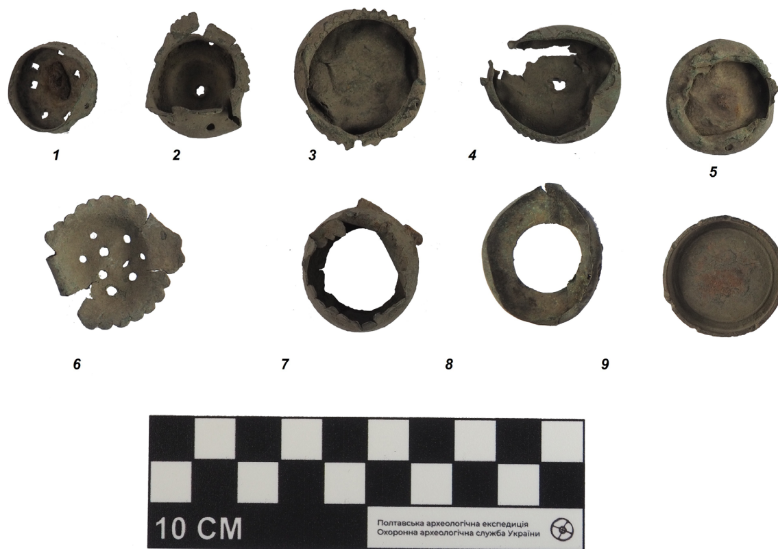
Рис. 2. Аксесуари люльок із розкопок у м. Полтаві. Кінець XVIII — перша третина XIX ст. Металевий сплав, лиття, карбування. Розкопки Юрія Пуголовка 2019–2020 рр.

Територіально близькою аналогією до описаних предметів є кришечка, що походить із розкопок ями кінця XVIII — першої половини XIX ст. в колишньому містечку Опішні (Зіньківщина) 16 (рис. 5). Форма округла, 5,0×3,3 см. З одного боку — застібка, з іншого — плоска пластинка для кріплення, краї прикрашені зубчиками, по центру — округлий стовпчик.