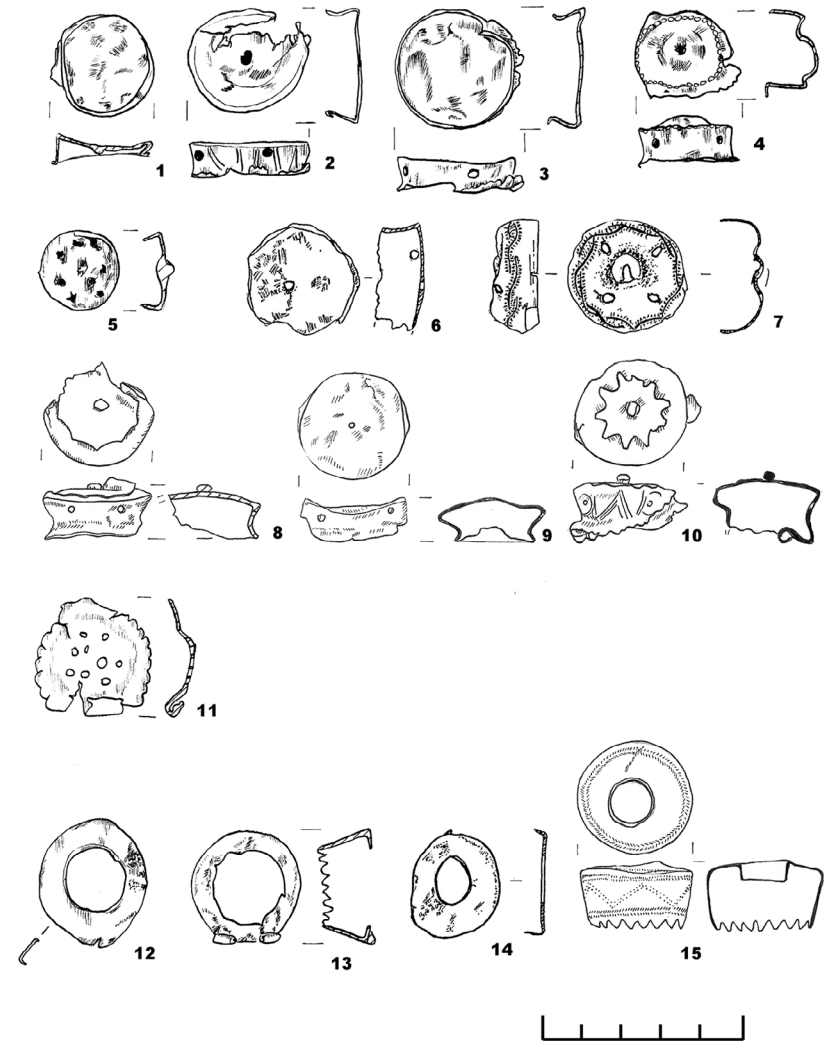
Рис. 1. Аксесуари люльок із розкопок у м. Полтаві. Кінець XVIII – перша третина XIX ст. Металевий сплав, лиття, карбування. Розкопки Юрія Пуголовка 2019–2021 рр.

Переважає більшість таких виробів неорнаментовані, однак три кришечки й одне окуття мають доволі складне оздоблення. Один виріб прикрашено прокресленими рисками по боковій частині (рис. 1, 2; 2, 4). Кришечка (рис. 1, 4; 2, 3) зверху має виділену опуклість, яка обмежена чеканною зубчастою