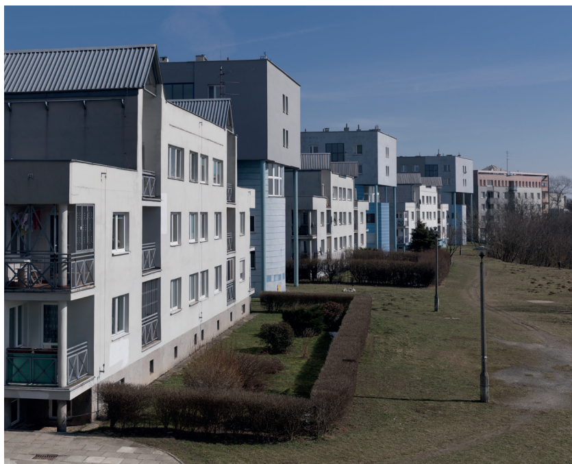
Fig. 6, 7

The Centre E Estate in Nowa Huta