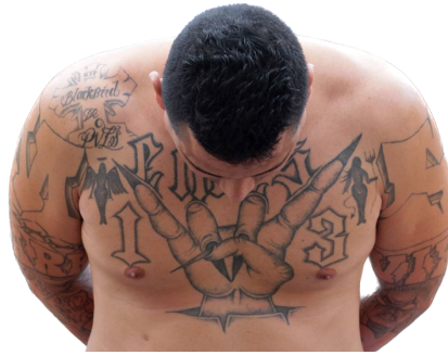
Figura 7. Un miembro de las maras en una prisión de El Salvador.

El número 13 también tiene un significado, sólo que más cercano a la violencia de la banda. El número está relacionado tanto con la edad a la que un joven puede convertirse en miembro de la Mara, como con los 13 segundos de paliza para iniciar la MS-13. Similar al procedimiento adoptado también por la banda de la calle 18.