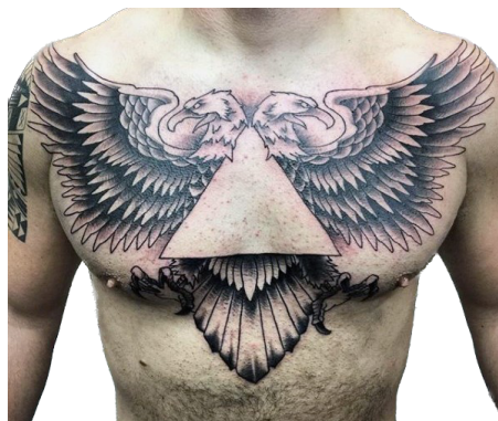
Figura 8. Tatuaje en el pecho, águila bicéfala con triángulo.

En la cultura de la Mafia, los tatuajes a menudo incluyen símbolos como la cruz de San Jorge, que simboliza la muerte y la resurrección, y el águila de dos cabezas, que representa el poder y la fuerza. También se utilizan símbolos como los puños, las armas y las rosas.