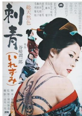
Figura 2. Irezumi (Tatuaje) .

A diferencia de la prostitución occidental, donde las mujeres trabajaban en burdeles o en la calle, en Japón , las mujeres de la prostitución eran confinadas a barrios específicos conocidos como "yūkaku". Estos barrios eran zonas cercadas que se encontraban a menudo a las afueras de las ciudades y pueblos y estaban divididos en pequeñas calles y callejones que contenían numerosos prostíbulos. Por lo tanto, las prostitutas también llevaban tatuajes para identificar su profesión. A menudo, los tatuajes eran grandes y elaborados, y se hacían en la espalda de la mujer.