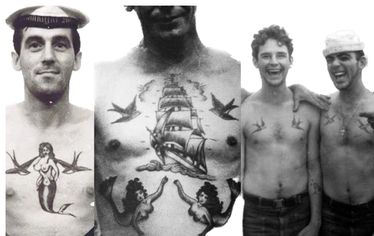
Figura 1. Tatuajes dentro de la cultura marítima.

Estos tatuajes también podían incluir elementos específicos relacionados con el barco en el que el marinero estaba navegando, su posición en la tripulación o eventos importantes en su vida. Estos, en la cultura marítima, tenían un gran significado para los marineros y eran una forma de expresar su identidad y experiencia en el mar.