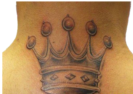
Figura 6. Una corona de 5 puntas.

Además de las coronas, los Latin Kings utilizan una variedad de tatuajes y graffitis para identificarse entre ellos y marcar su territorio. Sin embargo, es importante destacar que estos tatuajes deben ser autorizados por la organización. Algunos de los tatuajes autorizados incluyen una corona de cinco puntas, un león, un rapero, una estrella de cinco puntas, un castillo de cinco torres, una cabeza con una corona de cinco puntas, un diamante o las iniciales LK, ALNK, LNK o ALCN escritas en caracteres góticos. Un detalle interesante es que todos estos tatuajes presentan un elemento que se repite cinco veces, como las puntas de la corona o las torres del castillo.