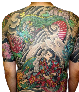
Figura 5. Dragon Tattoo.

Los tatuajes desempeñan un papel importante en la cultura y la identidad de los Yakuza. McLelland (2000) comenta que, estos tatuajes, que cubren gran parte del cuerpo o incluso todo él y son una forma de mostrar el rango y la afiliación a un clan específico dentro de la organización. Inicialmente, los miembros de los Yakuza comenzaban con un tatuaje pequeño y luego iban añadiendo tatuajes más grandes a medida que ascendían en la jerarquía de la pandilla. Los diseños de los tatuajes varían, pero suelen incluir símbolos asociados con el poder, la fuerza y la lealtad.