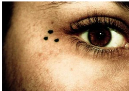
Figura 3. Tres puntos .

Uno de los principales motivos detrás de los tatuajes carcelarios es la necesidad de pertenecer a un grupo o pandilla. En la cárcel, los reclusos a menudo se agrupan en pandillas y estos grupos pueden estar identificados por ciertos tatuajes o símbolos. Estos tatuajes pueden incluir palabras o frases que representen la filosofía de la pandilla, como "solo Dios puede juzgarme" o "vida loca". También pueden tener símbolos que representen a la pandilla, como una cruz para los Latin Kings o una araña para la Mara Salvatrucha.