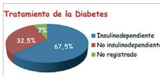
Gráfico 2. Tratamiento de la Diabetes.

Un 67,5% de los diabéticos es insulino dependiente y un 32,5% es no insulino dependiente; en un 7% de los pacientes diabéticos no se refleja esta variable. Gráfico 2.