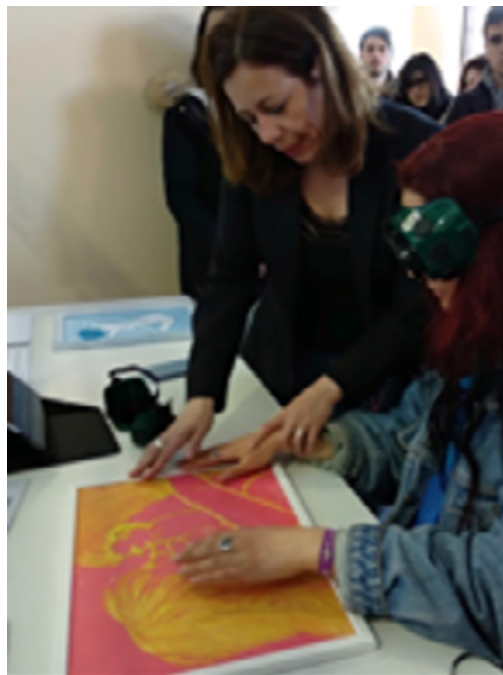
Estudiante universitaria con gafas de simulación de ceguera explorando un relieve táctil y escuchando la audiodescripción de la obra Nosotros en la exposición Dibujando a Ciegas