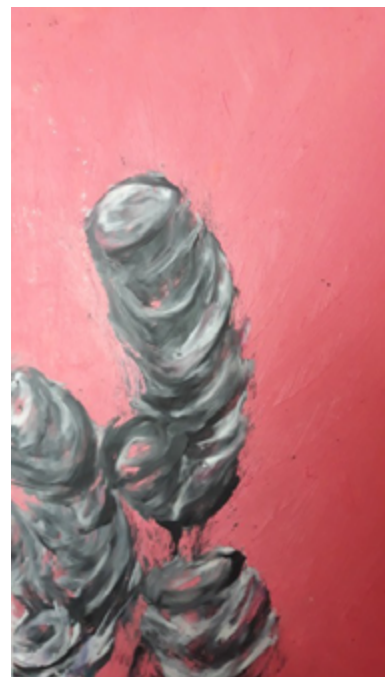
Paula de Diego, la Feminidad (Cris de Diego, 2019). Audiodescripción disponible en: https://crisdediego.es/2020/09/17/paula-de-diego-the-femininity-paula-de-diego-la-feminidad/