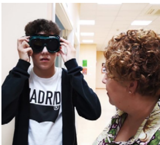
Visitante adolescente de la exposición Dibujando a Ciegas probando unas gafas de simulación de ceguera con resto de visión