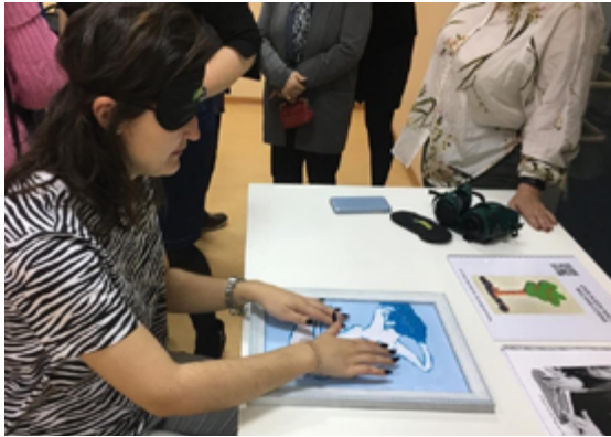
Estudiante de Formación Profesional explorando un relieve táctil con audiodescripción en la exposición Dibujando a Ciegas