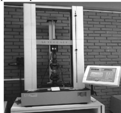
Figura 1. Maquina Universal

Para el estudio de los nanocompuestos y polipropileno puro, se utilizó una maquina universal marca Shimadzu AGS-20kNG (ver figura 1). La velocidad utilizada para cada prueba fue de 10 mm/min..