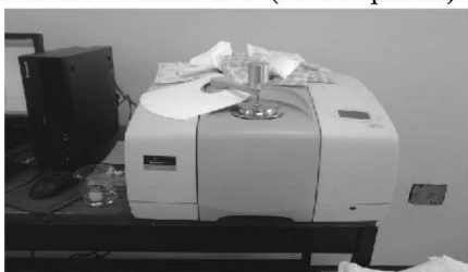
Figura 2. FTIR equipado con ATR

Se utilizó un FTIR de marca Perkin Elmer Spectrum 100 equipado con un ATR de marca PIKE con punta de diamante (ver figura 2). El programa que se usó para procesar los datos fue el Spectrum. Se usó para analizar alguna posible reacción debido a la incorporación del ácido esteárico a los nanocompuestos. Por esta razón se analizó la matriz polimérica (XH1760 Profax) y el ácido esteárico para poder comparar los espectros. El número de onda utilizada fue de 4000 a 600 \text{cm}^{-1} en la región del infrarrojo medio, graficando contra % de transmitancia para hacer los espectros. Para este análisis, se tomó una pequeña muestra de cada material (nanocompuestos).