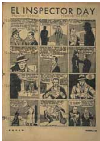
Hemeroteca Nacional, Universidad Autónoma de México. 22

Durante las pesquisas de esta investigación, también se descubrió que entre 1937 y 1939 aparece en la escena la historieta El inspector Day , publicada por la Editorial Juventud.