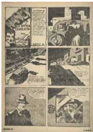
Hemeroteca Nacional, Universidad Autónoma de México. 24

Sin embargo, el que se considera el primer texto policiaco mexicano es Vida y Milagros de Pancho Reyes , de Alfonso Quiroga, escrito en los años veinte; historia que narra las aventuras del detective mexicano: