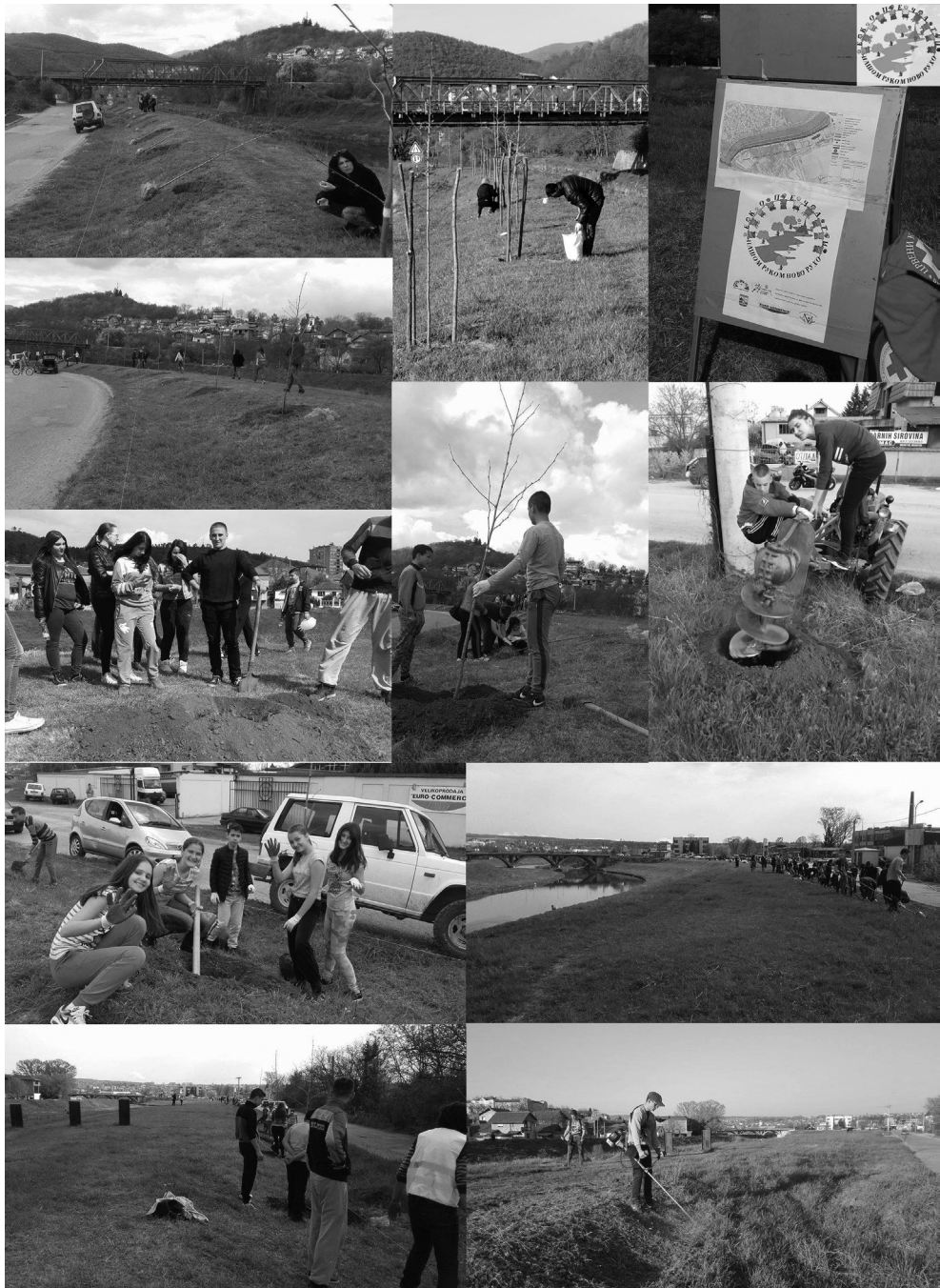
Slika 2. Članovi udruženja "Prijatelji dece Prokuplje" i ekološke sekcije škola iz Prokuplja uređuju kej reke Toplice.