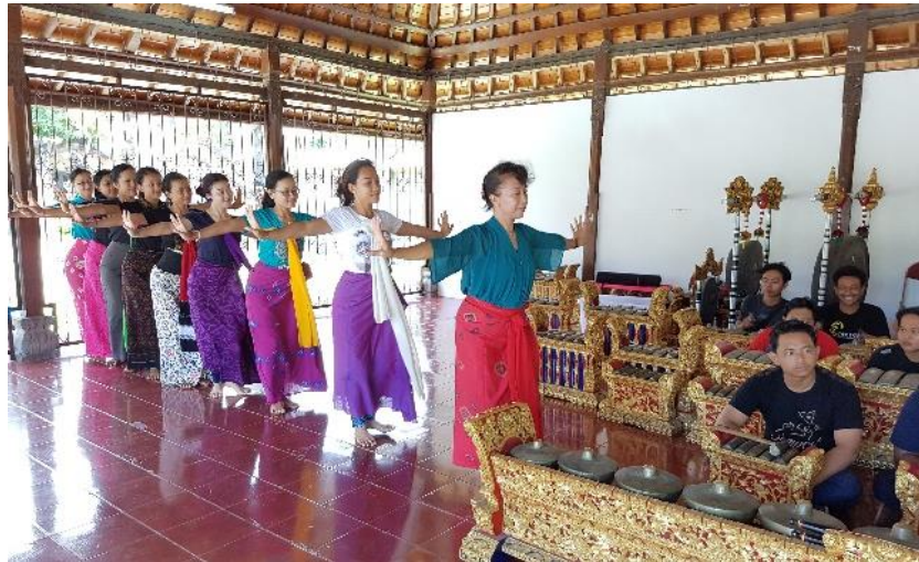
Gambar 2. Proses Latihan dengan Gamelan