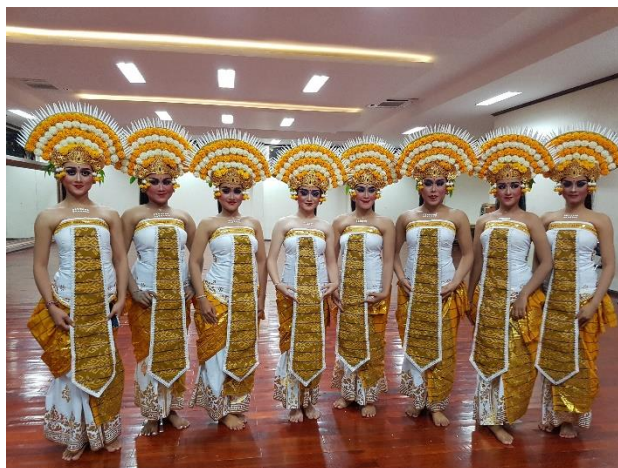
Gambar 5. Tata Rias dan Busana

Dalam tari Bali terdapat berbagai macam tata rias dan busana yang berfungsi untuk menunjukkan perwatakan atau karakter. Tata rias yang dipergunakan dalam Rejang Pakuluh adalah tata rias panggung, yaitu menampilkan kesan ketegasan raut muka pada wajah penari dengan maksud untuk menyesuaikan efek pencahayaan pada malam hari. Tata busana mempergunakan warna putih kuning sebagai simbol kesucian. jenis busana yang dipakai oleh penari yaitu hiasan kepala/gelungan yang dihiasi dengan bunga warna putih dan kuning, tutup dada warna putih kombinasi warna kuning, hankin warna putih di cat emas/prada, lamak warna kuning motif endek, kamen/kain ndek motif kotak warna kuning, dan tapih warna putih di cat warna emas/prada.