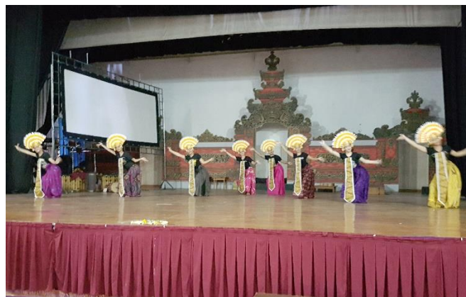
Gambar 3. Gladi Bersih

Penyajian karya seni merupakan akhir sebuah proses penciptaan. Keutuhan dan keberhasilan penyajian sangat didukung oleh beberapa penunjang seperti; tempat pertunjukan, tata rias dan busana, musik iringan dan tata lampu. Tempat Pertunjukan Tari Rejang Pakuluh akan dipentaskan di gedung Natya Mandala Institut Seni Indonesia Denpasar pada Hari Kamis tanggal 29 September 2016 pukul 19.00. WITA.