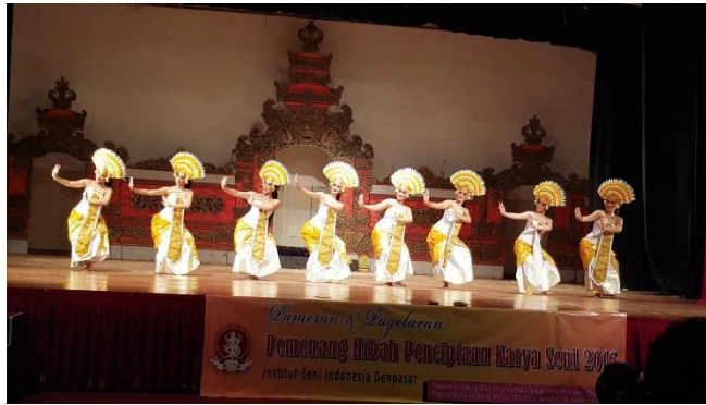
Gambar 4. Pementasan