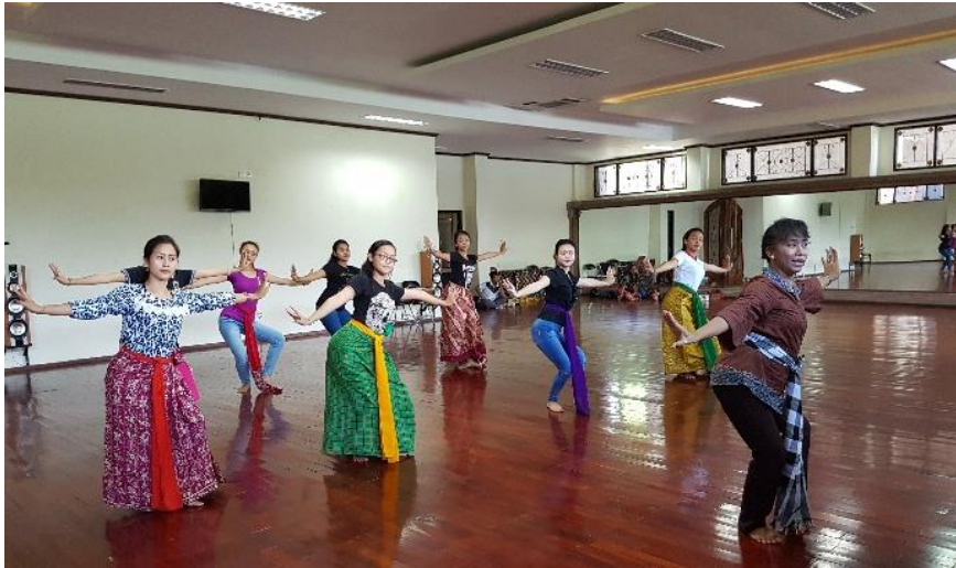
Gambar 1. Proses Penuangan Gerak

upacara. Gerakan tarian ini sangat sederhana agar tetap mempertahankan pola-pola rerejangan seperti berbaris, melingkar dengan lebih mengutamakan ekspresi kehendak dan rasa pengabdian kepada Tuhan. Diiringi Gamelan Gong Gede dengan durasi pementasan 10 menit.