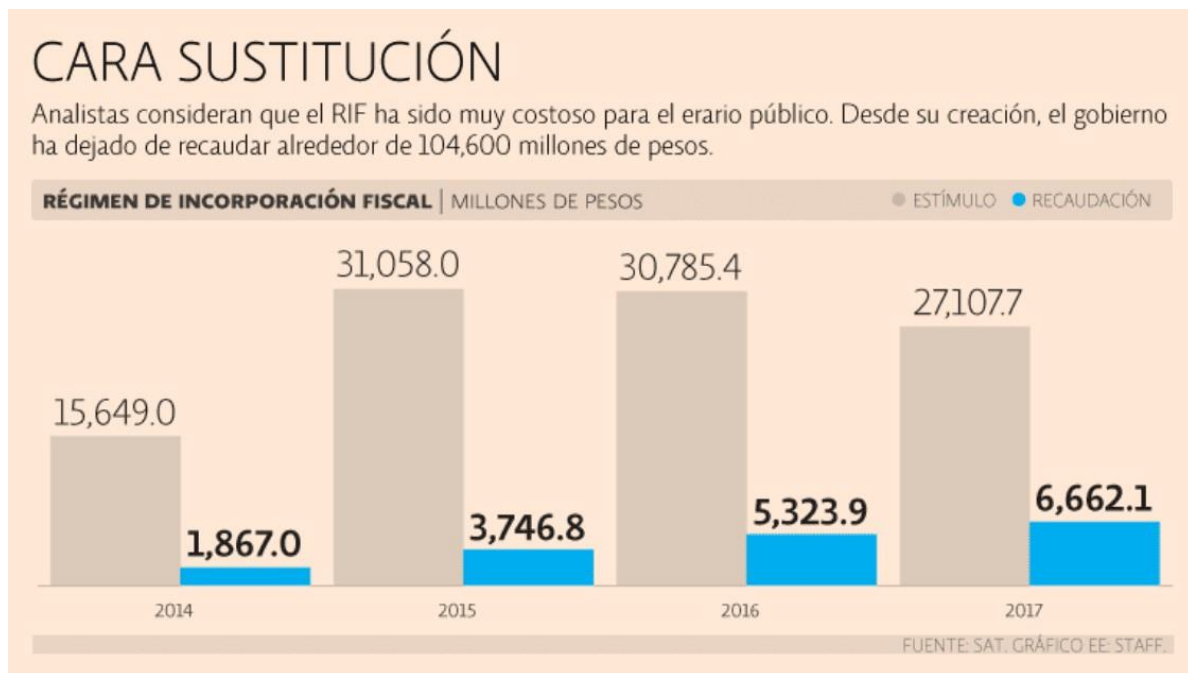
Imágen 2.0 Costo vs recaudación RIF

Recordó que de acuerdo a lo estipulado, los contribuyentes que se adhieran a este régimen, en el primer año, tendrán una exención de 100% en el pago de sus impuestos; en el segundo de 90%; en el tercero de 80% y así sucesivamente hasta que en el décimo año paguen la totalidad de lo que les toca, ya sin exenciones.