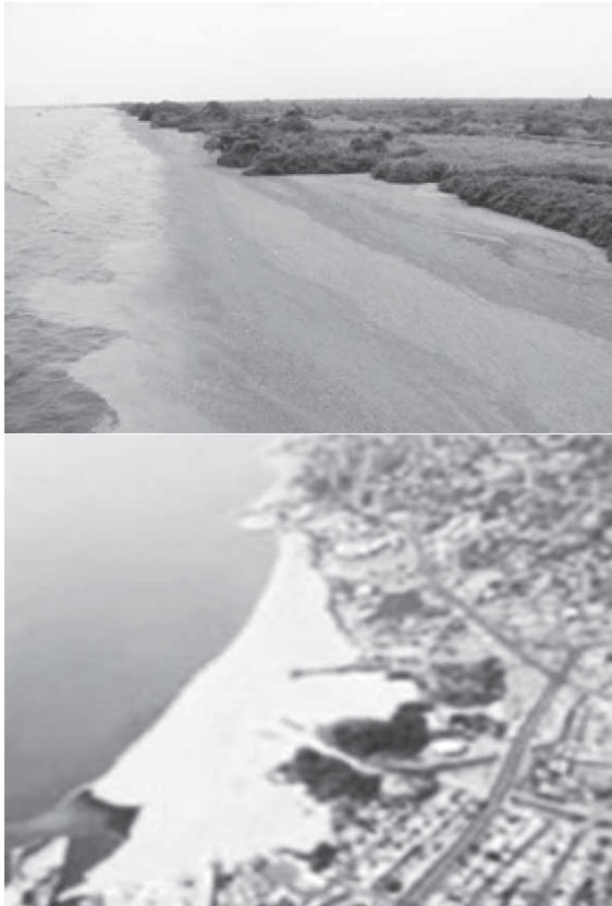
Figura 2. Lemna obscura en lago de Maracaibo ( www.vitalis.net ). Crecimiento de Lemna sp a lo largo de la costa (tonos grises en la foto izquierda y blanco en la derecha).

interferir con la navegación del lago, afectar la actividad pesquera y la descomposición de esta biomasa vegetal puede ocasionar anoxia en estratos profundos del sistema, además de malos olores y potenciales problemas sanitarios (González 2004).