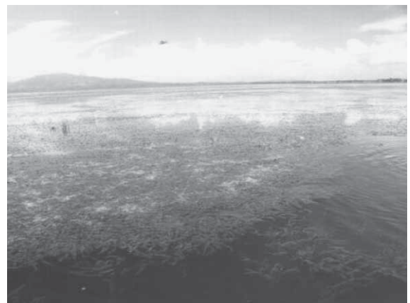
Figura 1. Hydrilla verticillata en Izabal (modificado de Haller [2002]).

El ingreso de Hydrilla verticillata al lago pudo deberse al transporte por embarcaciones provenientes de sistemas donde se encontraba la especie (Florida) o haber sido introducida por acuaristas; el huracán Mitch -en 1998- se menciona como la potencial causa de dispersión de esta especie en el lago y la salinidad como el factor limitante en el área de la desembocadura (Haller 2002). En el lago de Izabal, en octubre de 2002, la cobertura era cercana al 3 por ciento, ocasionando problemas menores a la pesca y la navegación (figura 1). De acuerdo con la profundidad donde puede establecerse la especie (0-6 m), la batimetría del sistema, las condiciones del sedimento y el potencial de dispersión, se esti-