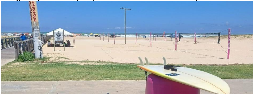
Figura 05: Estrutura para prática de atividades físicas e esportes na areia.