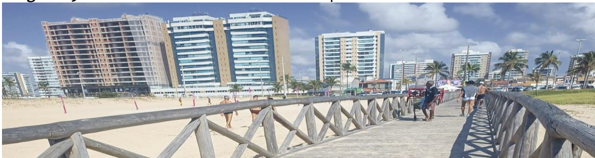
Figura 09: Passarela na Praia da Cinelândia e expansão imobiliária do bairro de Atalaia.

A partir do relato dos colaboradores entendemos que a Praia da Cinelândia é frequentada por um público diverso durante a semana e aos finais de semana. Também entendemos que uma parte significativa dos frequentadores são do próprio bairro de Atalaia, local de expansão e valorização imobiliária.