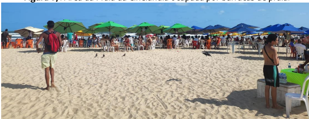
Figura 07: Área da Praia da Cinelândia ocupada por barracas de praia.

Por um lado, uma experiência de natureza associada ao conforto e ao consumo. Por outro lado, a natureza como paraíso intocado e reservado das páginas de revistas de turismo de natureza (nesse sentido, também idealizada como sonho de consumo).