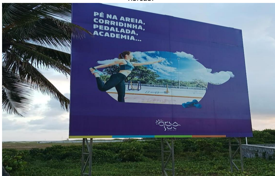
Figura 04: Outdoor na Praia da Cinelândia associando a praia com a prática de atividades físicas.

As unidades de significado nesta categoria foram divididas em 03 grandes grupos: atividades físicas, autocuidado e socialização. A praia como local propício para atividades físicas é uma concepção bem sustentada na modernidade, como evidenciado pela propaganda da Orla Sul (Figura 04), projeto em construção que dá continuidade à Orla de Atalaia no sentido do litoral sul de Aracaju. Aliás, a relação mais ampla entre natureza e atividade física é bem consolidada na modernidade, especialmente como evolução das escolas de educação ao ar livre (por exemplo, o escotismo e a Outward Bound ) e dos esportes na natureza (RODRIGUES, 2019b).