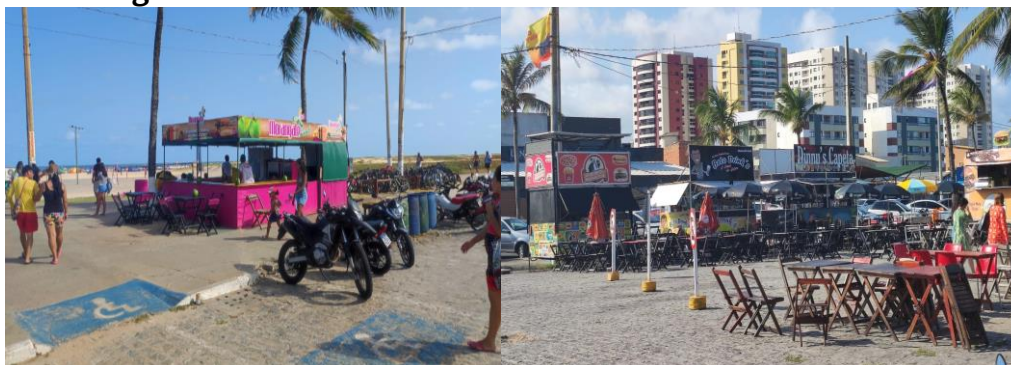
Figura 06: Estruturas comerciais fixas na Praia da Cinelândia.