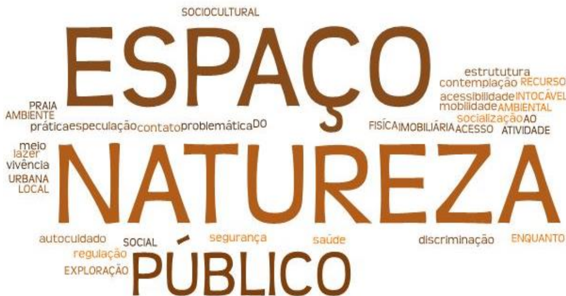
Figura 03: Mosaico de palavras elaborado a partir dos discursos dos colaboradores da pesquisa.

Para início de conversa, a Figura 03 mostra um mosaico de palavras construído no software ‘WordClouds.com’ a partir de todos os discursos dos colaboradores da pesquisa, frequentadores e comerciantes.