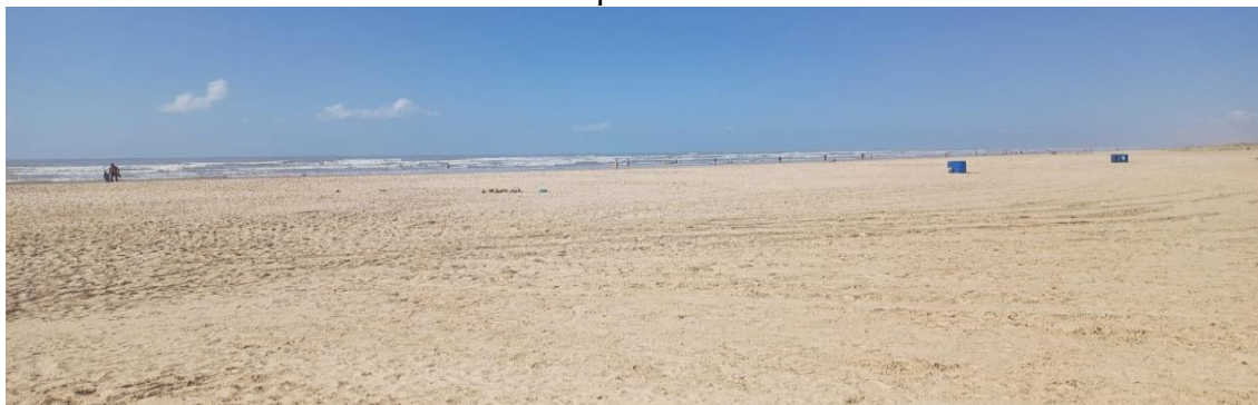
Figura 08: Praia da Cinelândia vazia ao amanhecer, antes da chegada das barracas de praia.