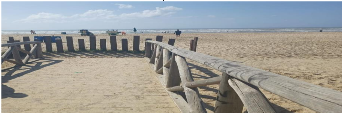
Figura 10: Barreiras para evitar utilização da passarela por proprietários de barracas de praia.

hipótese levantada). A falta de regulamentação gera uma relação confusa entre o poder público e os comerciantes, explícito em algumas falas que evidenciam diálogos e acordos sobre onde e como os comerciantes podem se estabelecer, ao mesmo tempo em que há a instalação de barreiras para evitar que os comerciantes usem a passarela de madeira.