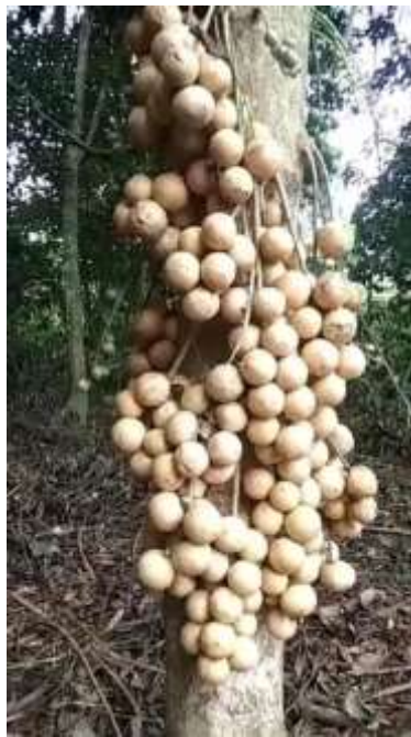
Gambar 1. Buah limpasu (Dokumentasi Pribadi, 2023)

FRAP, dan ABTS) pada pericarp, pulp, dan bijinya dengan kesamaan metode maserasi dan menunjukkan yang tertinggi aktivitas antioksidan yang ditemukan dalam ekstrak pulp (Zamzani & Triadisti, 2021). Baccaurea lanceolata ini merupakan buah tahunan kaya akan manfaat. Buah ini bisa dijumpai di daerah pedalaman yang lumayan sulit dijangkau namun tidak semuanya, beberapa juga ada yang ditemui tumbuh di pemukiman warga. Hal ini dikarenakan buah Baccaurea merupakan buah yang saat ini mulai diabaikan oleh masyarakat sekitar (Hikmah & Gunawan, 2022).