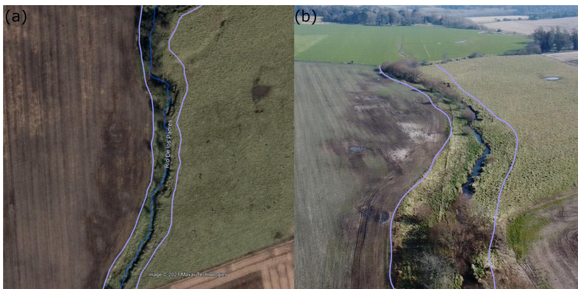
Figura 6-3. Ejemplo de delimitación de los ambientes ribereños en la cuenca del arroyo de Los Padres. La franja izquierda está caracterizada por un ambiente con límites claros entre vegetación natural y lote con otros usos. En la franja derecha el uso no es claro y se delimitaron sólo 10 m. a) Imagen tomada de Google Earth b) Imagen tomada desde dron.

no era claro el uso (por ejemplo, un campo con pasturas) se optó por digitalizar 10 metros desde el arroyo ( Figura 6-3 ).