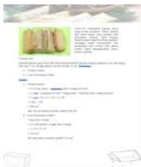
Gambar 4 Desain Materi

Pada halaman ini, berisi bagian-bagian berupa materi, tujuan, indikator dan kegiatan.