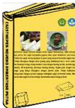
Gambar 5 Desain Cover Belakang

Halaman ini berisi materi-materi yang akan dipelajari saat kegiatan pembelajaran di kelas.