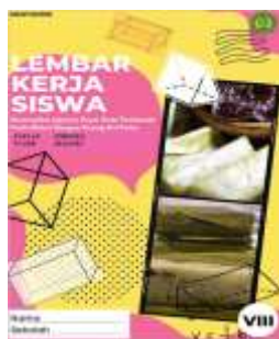
Gambar 3 Desain Cover

Pada halaman ini, berisi bagian-bagian berupa materi, tujuan, indikator dan kegiatan.