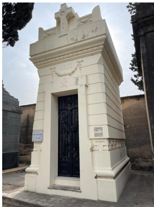
Figura N°3: Fotografía de las placas robadas. (Acerbi, 2024).