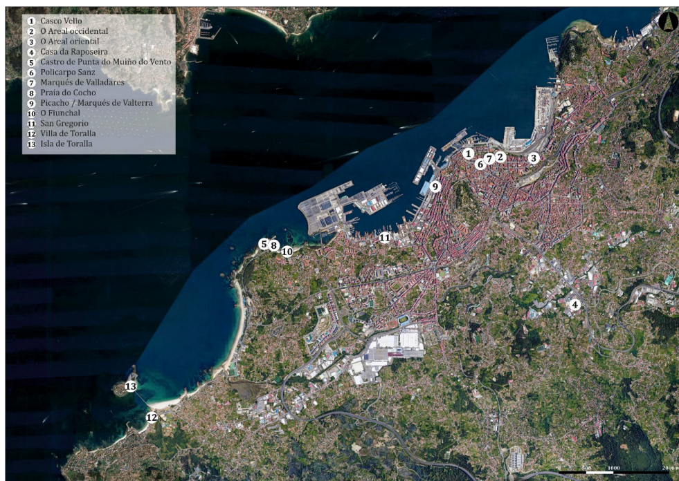
Fig. 5. Distribución de los espacios funerarios ubicados en el actual municipio de Vigo (base cartográfica: Google Satellite)

Se registra el uso de los dos tipos de disposición más comunes, la cremación y la inhumación, siendo la segunda la que se identifica en un mayor número de casos. Las cremaciones, que apenas alcanzan la decena, se localizan principalmente en los grandes conjuntos de O Areal, así como en el caso dudoso de Casa da Raposeira y probablemente en O Fiunchal. En su mayoría se trata de fosas simples, en las que los restos se depositaron en el interior de urnas (Tipo I) habitualmente de tamaño reducido, como el caso de las sepulturas de cremación recuperadas en la necrópolis de O Areal occidental, que ocasionalmente podían ir acompañadas en el interior de la fosa de restos de la pira. Se recuperan, sin embargo, algunos casos en los que no se preservan urnas, pudiendo haberse enterrado los restos dentro de algún recipiente de carácter perecedero o haber sido depositados directamente dentro de la sepultura, con o sin restos de pira (Tipo II o III). 59 Atendiendo a la tipología de las urnas empleadas, así como a los datos estratigráficos extrapolados de las excavaciones realizadas, este tipo de enterramiento parece haberse extendido al menos desde mediados del siglo III, momento en que se abandonan las salinas sobre las que se asientan las sepulturas, hasta al menos la segunda mitad siglo IV, compartiendo en algunos casos espacio con inhumaciones.