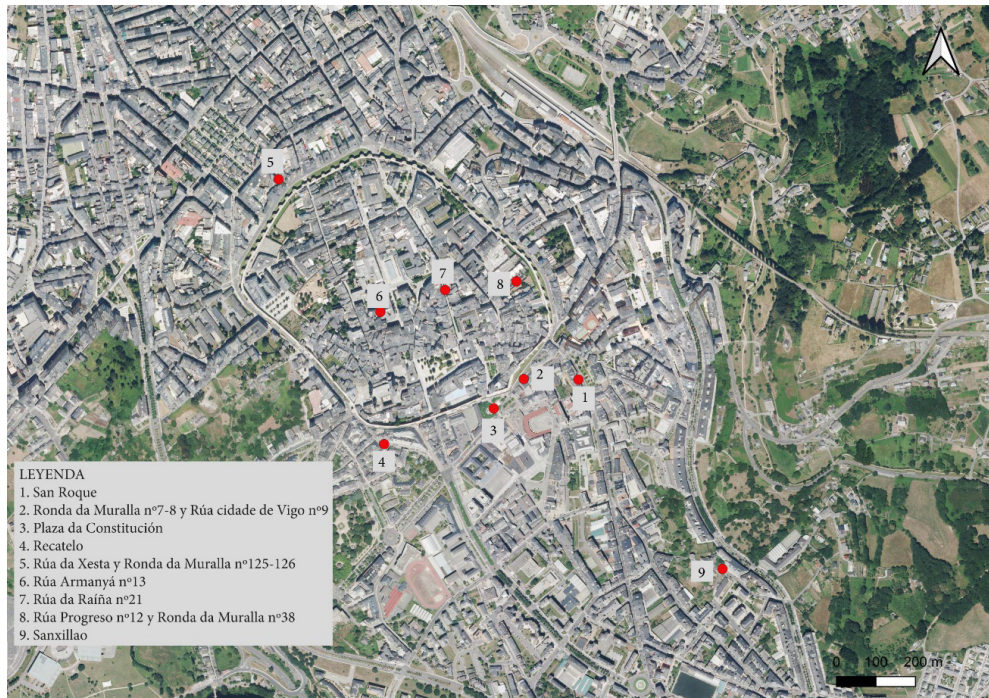
Fig. 2. Distribución de los espacios funerarios en la actual Lugo (base cartográfica: ortofoto PNOA)

funcional de un espacio a lo largo del tiempo, así como del cambio de práctica funeraria en el siglo IV, de cremación a inhumación. 24