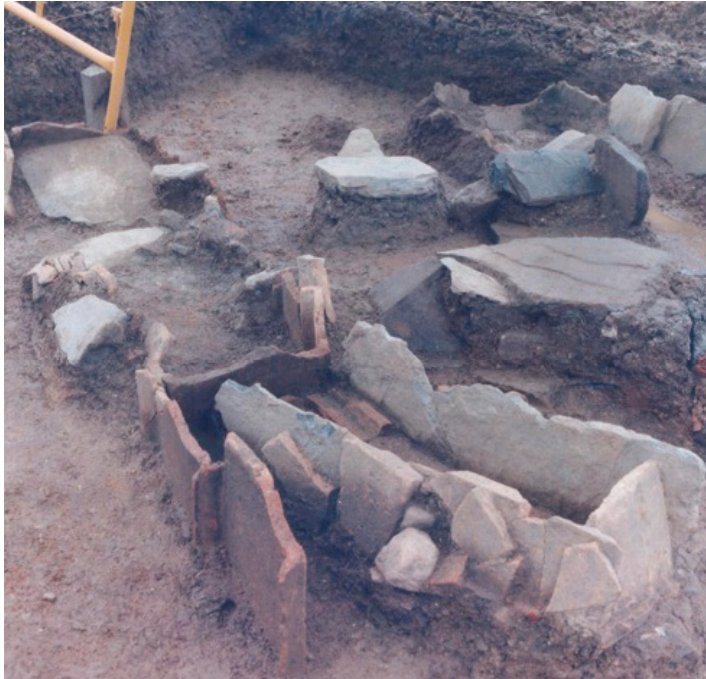
Fig. 3. Sepulturas en Plaza da Constitución (Sánchez Milão 2012, 29)

En Rúa da Xesta fueron localizadas cinco sepulturas de inhumación y restos de una escultura. Este grupo funerario destaca por su variada tipología, con presencia de fosas con laterales de pizarra e inhumaciones mixtas (base de tégula y cubierta a doble vertiente de pizarra), y la ausencia de ajuar y restos óseos. En tres de las inhumaciones se exhumaron restos de clavos pertenecientes a los ataúdes de madera. Debido a su tipología, así como a la proximidad de la necrópolis de incineración que quedó anulada por la muralla (Campo da Forca), R. Bartolomé Abaira propone una cronología de los siglos III-V para este espacio funerario. 41