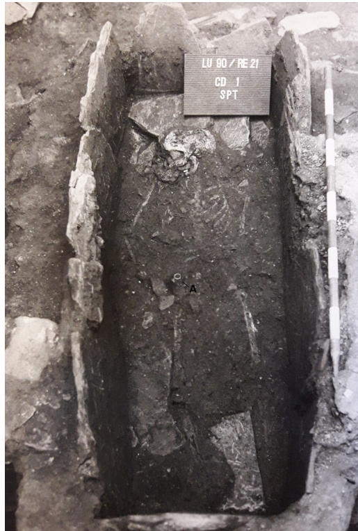
Fig. 4. Sepultura en Rúa da Raiña nº 21, en la que se observa el esqueleto que portaría el anillo decorado en su mano (González Fernández 1990, anexo fotográfico. Dirección Xeral de Patrimonio Cultural, Xunta de Galicia)