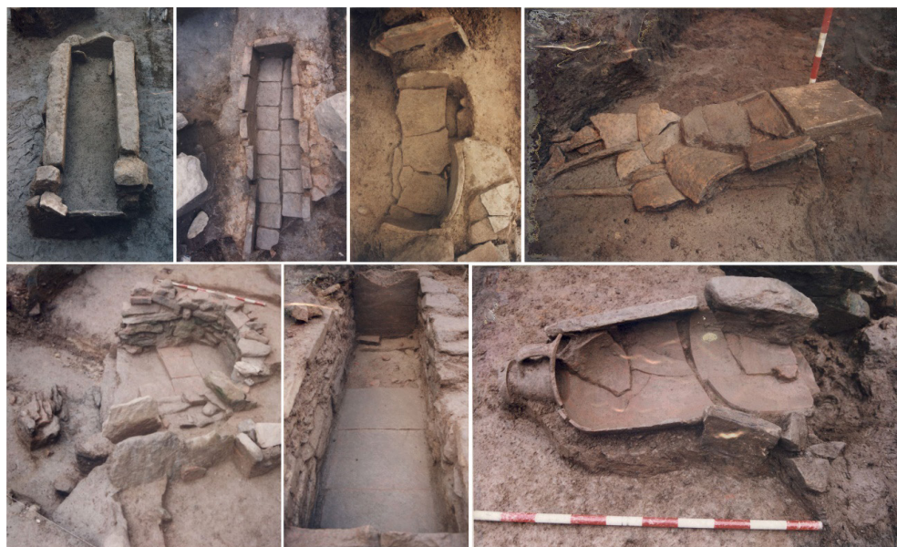
Fig. 6. Ejemplos de algunos de los tipos de sepulturas recuperados en la necrópolis de O Areal occidental

durante todo el periodo romano y tardorromano de la ciudad, mientras las segundas se vinculan habitualmente a los siglos IV-VI). La tendencia se diversifica un poco más, sin embargo, si nos centramos en los tres grandes conjuntos funerarios del Casco Vello y O Areal, con especial relevancia en el caso de O Areal occidental. En estos casos, el enterramiento en fosa sigue siendo el formato más común, recuperándose tanto fosas simples como delimitadas por uno o más materiales en parte de su contorno. Las cistas, principalmente aquellas construidas en piedra, son la segunda tipología más común, recuperándose asimismo estructuras construidas en tégula, tanto rectangular como en tejado a dos aguas, ladrillo o fragmentos de dolium , siendo especialmente relevante el número de estructuras de este tipo construidas en dos o más materiales diferentes, dando lugar a una tipología mixta (Fig. 6).