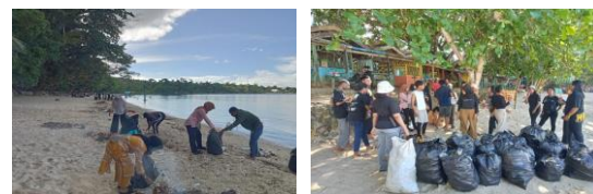
Gambar 3. Pemilahan Sampah

Secara keseluruhan, kegiatan ini mencerminkan komitmen untuk menjaga keindahan alam Pantai Putih dan membangun kesadaran masyarakat akan pentingnya konservasi lingkungan. Melibatkan mahasiswa sastra Indonesia dan sastra Inggris dalam kegiatan pengabdian ini juga merupakan bentuk pengintegrasian ilmu pengetahuan dan pendidikan untuk tujuan yang lebih luas, yaitu kelestarian lingkungan. Diharapkan bahwa kegiatan ini dapat menjadi model untuk kegiatan serupa di tempat lain dan memberikan dampak positif dalam jangka panjang terhadap pelestarian lingkungan pesisir di