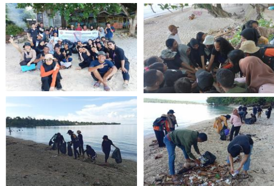
Gambar 2. Aksi Bersih Sampah

Setelah pengumpulan sampah selesai, sampah-sampah yang telah terpisah antara organik dan non-organik dibuang dengan benar di Tempat Penampungan Sampah Sementara (TPS). Sampah organik akan diarahkan untuk pengomposan, sedangkan sampah non-organik akan diangkut ke fasilitas pengolahan sampah sesuai dengan jenisnya. Langkah ini penting untuk memastikan bahwa sampah yang telah terkumpul dapat diolah dengan cara yang sesuai dan ramah lingkungan.