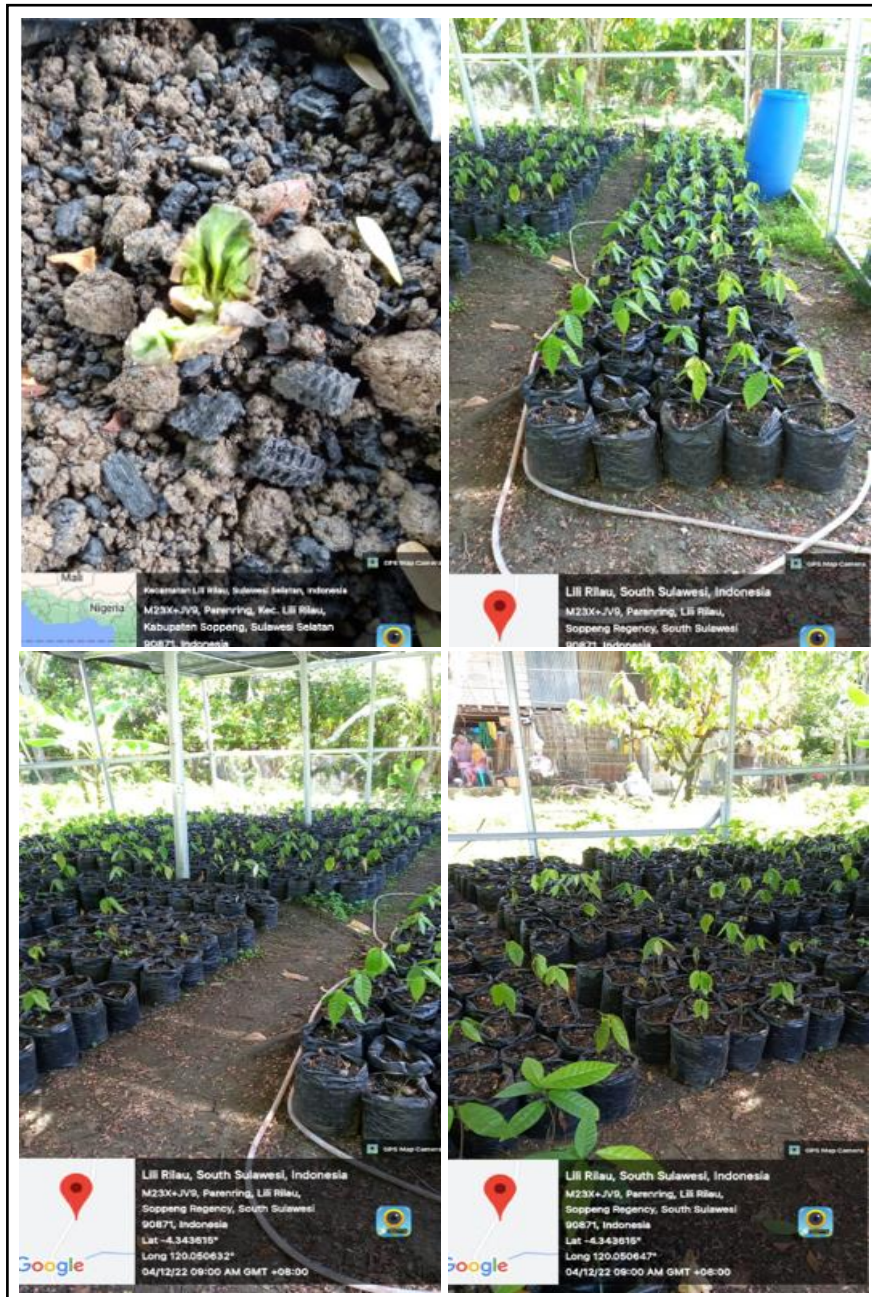
Gambar 5. Pertumbuhan Bibit Kakao Diawal dan Setelah Satu Bulan Penanaman.

bentuk kolaborasi manusia dan lingkungan yang respirokal juga fungsional dalam upaya pengendalian resiko perubahan iklim (Dharmawan et al., 2014).