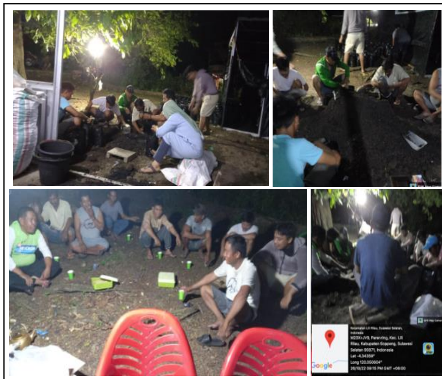
Gambar 3. Pengisian polibag melibatkan kelompok tani.