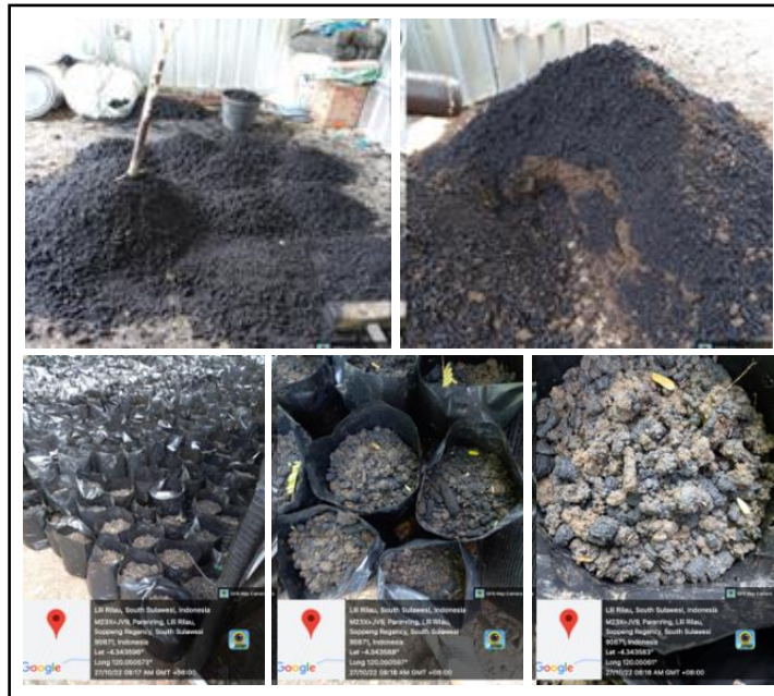
Gambar 1. Media Tanam dari Biochar Tongkol Jagung Ditambah Tanah.

liter per polibag. Sebelum dicampur dengan tanah biocar dihaluskan dengan cara ditumbuk (Gambar 1).