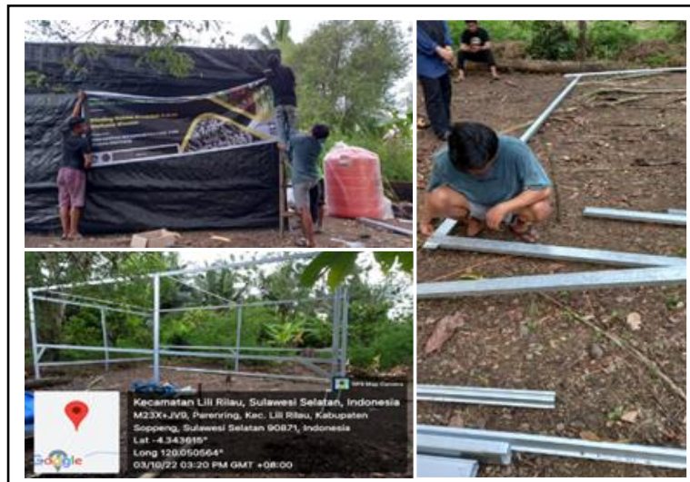
Gambar 2. Pembuatan Rumah Bibit.

Pengisian media tanam untuk bibit melibatkan kelompok tani Mamminasa Deceng. Dalam kegiatan ini media tanam yang disiapkan sebanyak 1000 polibag (Gambar 3).