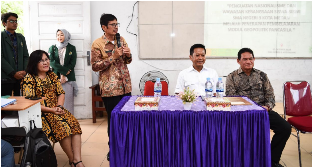
Gambar 3. Momen ketika Kepala Sekolah SMA Negeri 3 Kota Medan memberikan kata sambutan