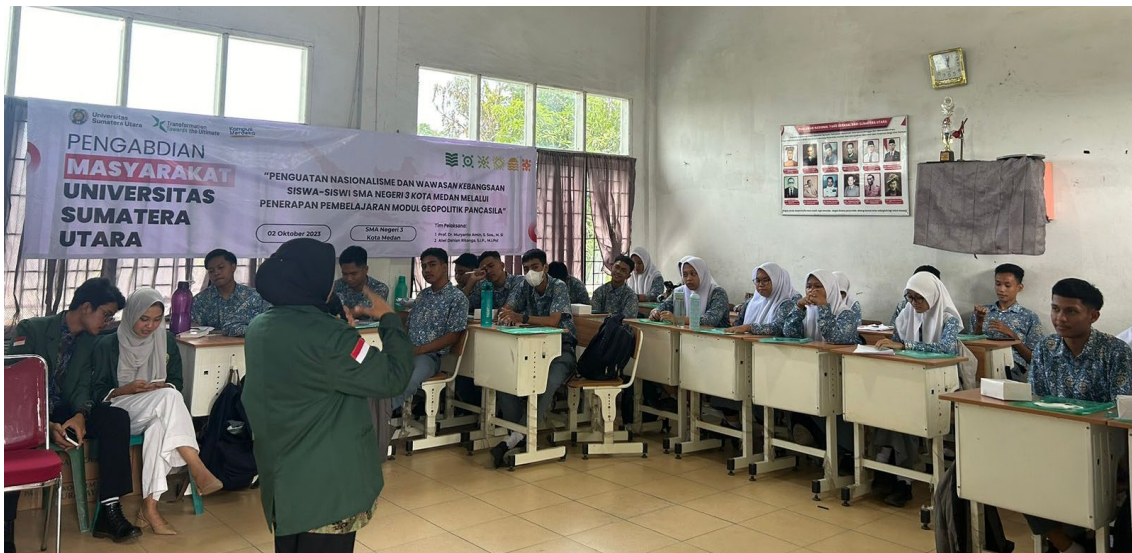
Gambar 5. Momen ketika mahasiswa memberikan pengajaran tentang modul geopolitik Pancasila