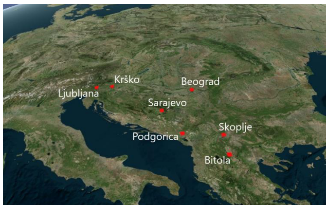
Slika 1: Lokacije uzorkovanja iz GRAMON baze podataka.

Podaci za Srbiju i Sloveniju datiraju od 1991. godine, za Crnu Goru i Severnu Makedoniju od 2008, a za Bosnu i Hercegovinu od 2010. godine.