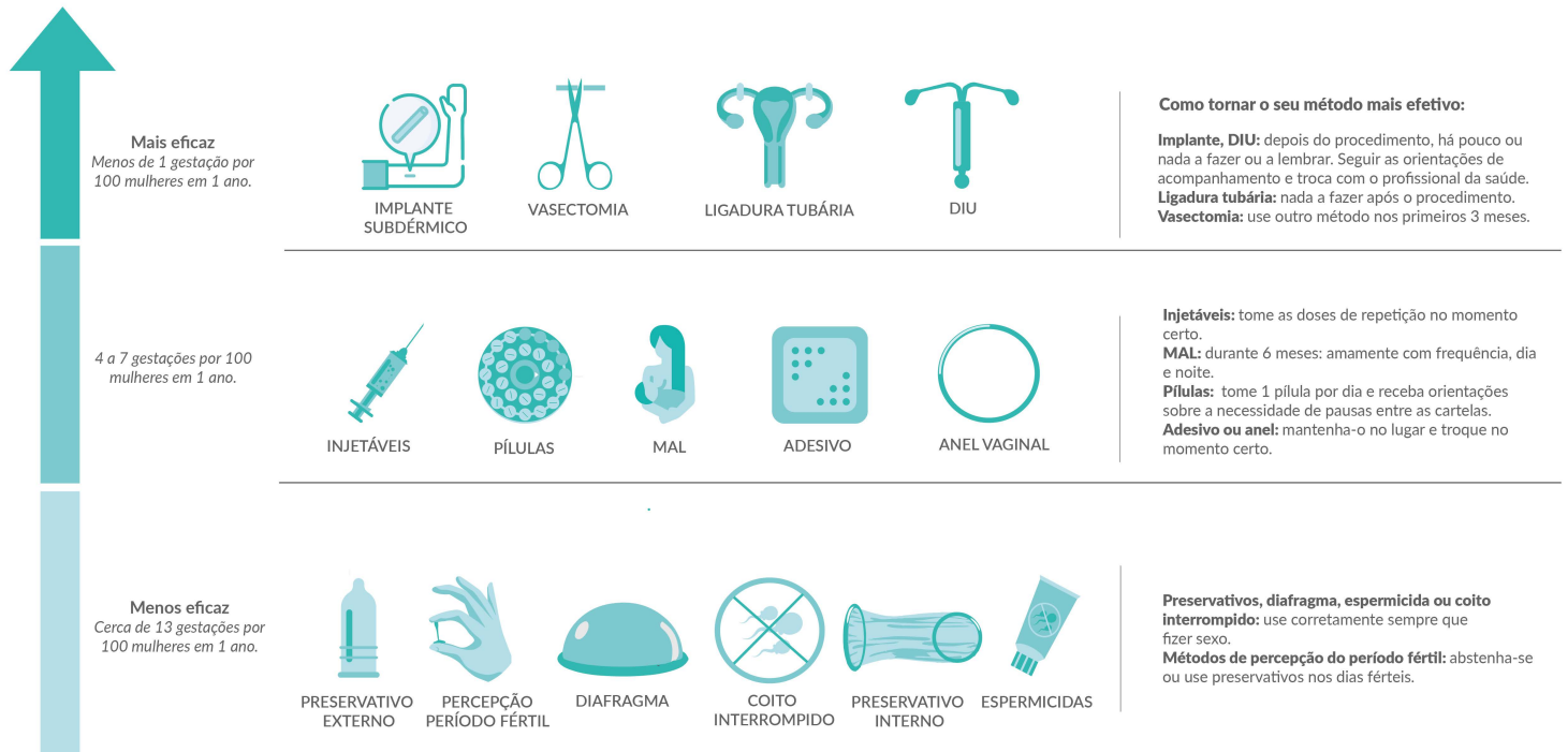
Figura 2 – Comparação da eficácia com o uso típico de métodos contraceptivos.

DIU: dispositivo intrauterino; MAL: Método de Amenorreia Lactacional.