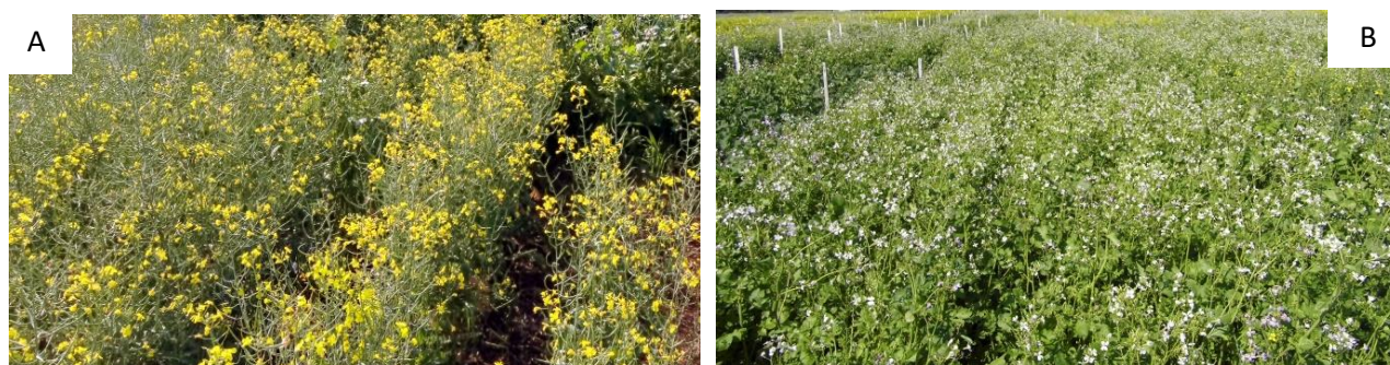
Figura 2. Testemunha capinada (A) e demais tratamentos que não controlaram o nabo (B) no ensaio de eficácia de herbicidas em canola. UFFS, Campus Erechim/RS, 2020.

Por ser uma planta daninha muito competitiva e apresentar elevada estatura, o nabo sombreou completamente as plantas de canola nas unidades experimentais (Figura 2B), onde não se teve o controle do mesmo, dificultando assim até mesmo encontrar as plantas da cultura no momento da colheita.