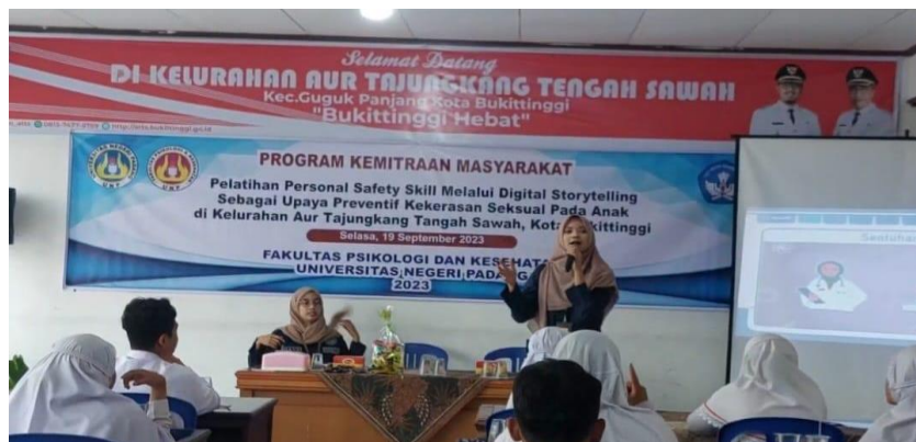
Gambar 4. Psikoedukasi personal safety skill melalui digital storytelling

Sejalan dengan penjelasan Janah (2023) bahwa pendidikan seksual pada anak tidak hanya mencakup konteks perbedaan gender dan perkembangan alat reproduksi namun juga meliputi pengembangan kepercayaan diri serta meningkatkan kompetensi anak dalam menentukan tindakan yang sesuai saat menghadapi sebuah situasi sehingga terhindar dari kejahatan seksual. Riset yang dilakukan oleh Juarni dkk (2020) menunjukkan bahwa semakin tinggi pemahaman anak mengenai proteksi diri terhadap kekerasan seksual dapat meningkatkan keterampilannya dalam melindungi diri. Setelah penyampaian materi selesai, maka dilakukan review materi melalui metode menyanyi untuk meningkatkan keterlibatan dan pemahaman anak. Febriagivary (2021) memaparkan bahwa metode bernyanyi merupakan salah satu alternatif yang dapat digunakan dalam memberikan edukasi pada anak.