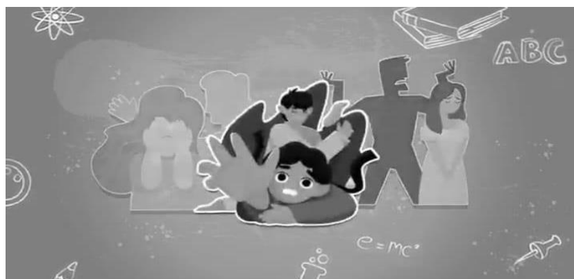
Gambar 5. Contoh konten pelatihan dalam bentuk digital storytelling