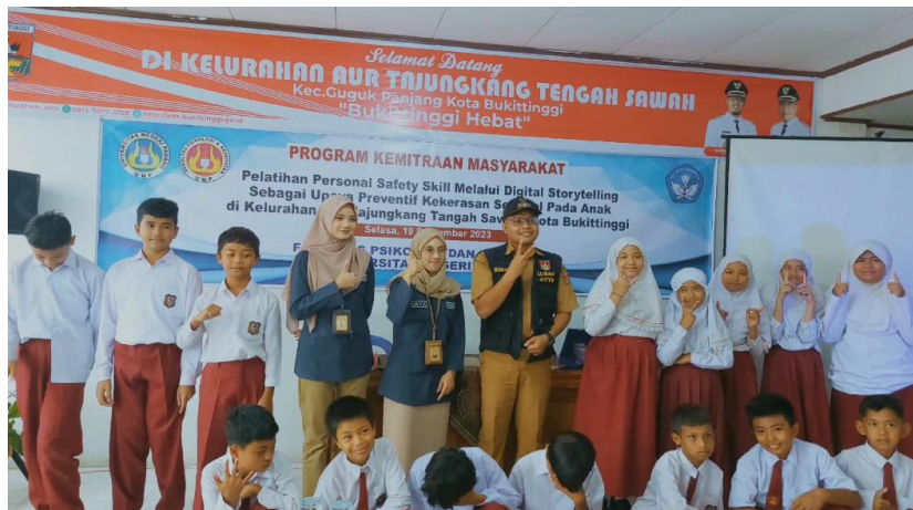
Gambar 7. Penutupan kegiatan pengabdian masyarakat oleh Lurah Aur Tajunggang Tengah Sawah, Bukittinggi