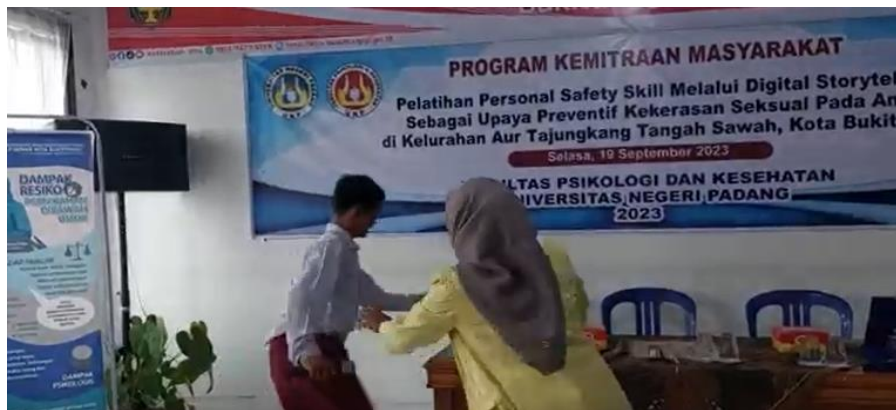
Gambar 6. Kegiatan roleplay

Pada sesi ini anak dilatih untuk melakukan tindakan tindakan konstruktif saat menghadapi kejahatan seksual melalui roleplay. Ibrahim dan Syaodih (2003) menjelaskan bahwa metode roleplay bertujuan untuk mengimplementasikan nilai dan kemampuan pemecahan masalah dalam konteks sosial. Dalam kegiatan ini fasilitator berperan sebagai pelaku kekerasan seksual dan anak berperan sebagai pihak yang berhadapan pada situasi yang mengarah pada kekerasan seksual dan melakukan upaya konstruktif untuk menyelamatkan dirinya. Selain itu anak juga dihadapkan pada situasi sebagai “saksi” dimana anak melihat kekerasan seksual yang dialami oleh teman sebaya atau anak lainnya di sekitarnya dan melakukan upaya konstruktif guna membantu temannya. Seluruh peserta tampak cukup asertif dalam menolak ajakan/bujukan dari pelaku dan melakukan tindakan konstruktif seperti berteriak, berlari, memukul hingga melaporkan ke orang terdekatnya. Beberapa kegiatan pengabdian terdahulu menunjukkan bahwa roleplay efektif dalam mengedukasi dan meningkatkan perlindungan anak terhadap kekerasan seksual (Maulinda dkk, 2022).