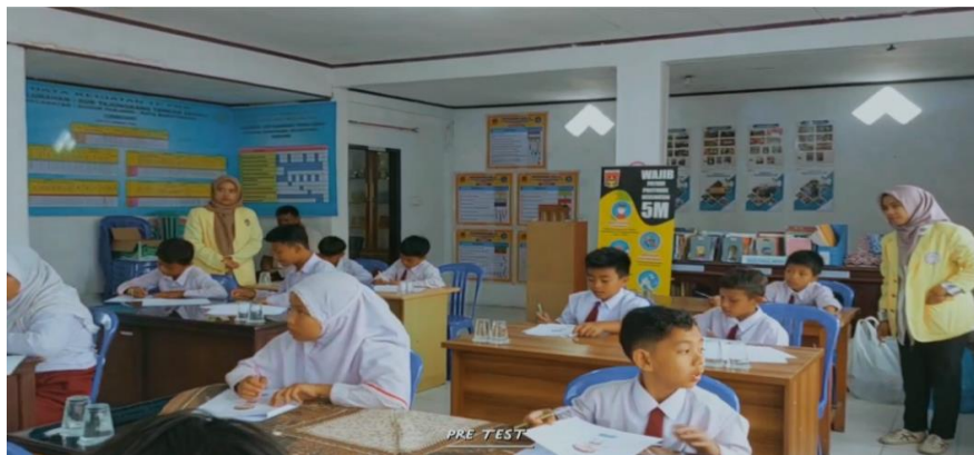
Gambar 3. Pengerjaan pretest oleh peserta kegiatan

Kegiatan ini merupakan pemberian tes awal untuk mendapatkan gambaran umum terkait personal safety skill pada anak. Tes menggunakan skala yang disusun berdasarkan teori Bagley dan King (2003) yaitu : recognize, resist dan report