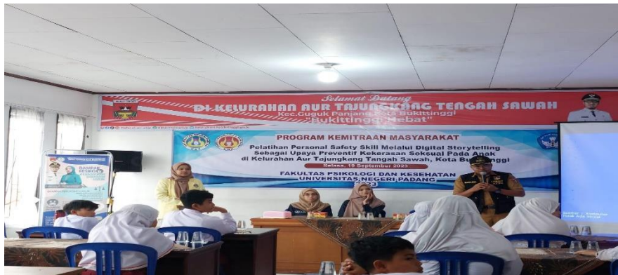
Gambar 2. Pembukaan kegiatan pengabdian masyarakat oleh Lurah Aur Tajunggang Tengah Sawah, Bukittinggi